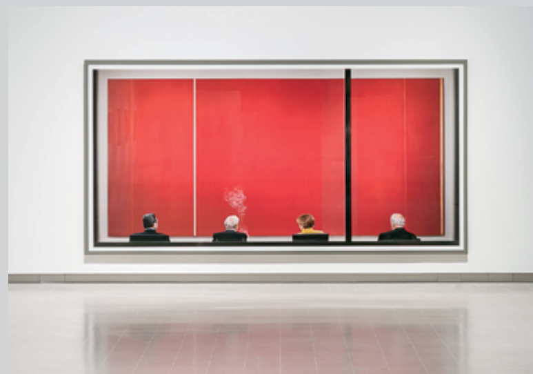
Vue d'installation à la Hayward Gallery, à Londres