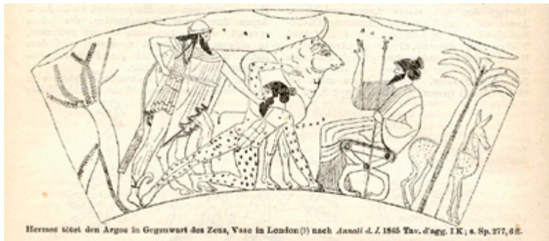
PAGE 40 Dessin d'une image du V e siècle avant Jésus Christ d'un vase montrant Hermès attaquant le géant Panoptès / Drawing of an image from a fifth-century BCE Athenian red figure vase depicting Hermes slaying the giant Argus Panoptes Paon / Peacock