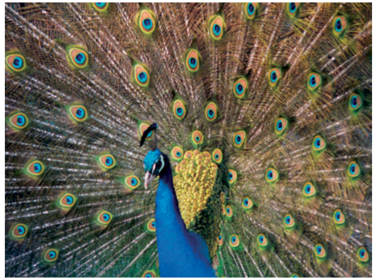
PAGE 41 No Time for Tomorrow , 2014 extrait vidéo / video still

Et voilà pourquoi les yeux de Panoptès se retrouvent sur les plumes du paon. D'ailleurs, dit Michel Serres, lorsqu'il raconte ce mythe: « Est-ce que vous voyez le paon faire la roue? Pas vraiment, il vous voit ». Le paon nous voit, donc les écrans aussi. Comme l'oiseau qui a bénéficié du geste divin de Héra, la technologie a fait de la machine-écran l'héritière de ces ocelles qui nous scrutent « tout le temps, dans toutes les directions, à n'importe quelle distance ». À l'ère numérique, les écrans sont devenus les nouvelles reliques. Nous pensons les regarder, mais ce sont bien eux qui nous regardent. L'écran vert, dont la capacité de métamorphose égale celle de Zeus, illustre particulièrement bien les liens ténus que l'on peut tisser entre la technologie et le divin.