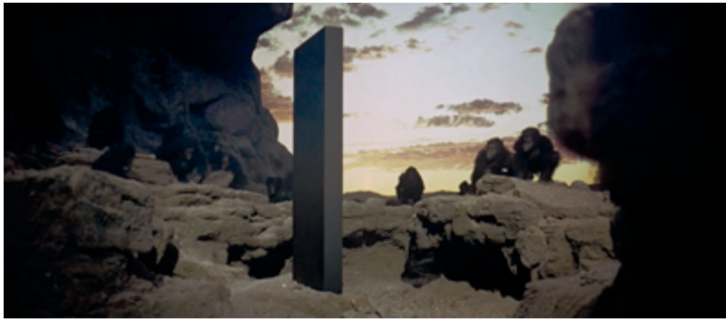
PAGE 42 Stanley Kubrick 2001, Odyssée de l'espace / 2001, A Space Odyssey , 1968 extrait / film still