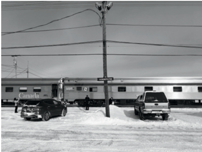
Homepayne Ontario, 2017 archive personnelle / personal archive Tété, 2010 archive familiale / family archive