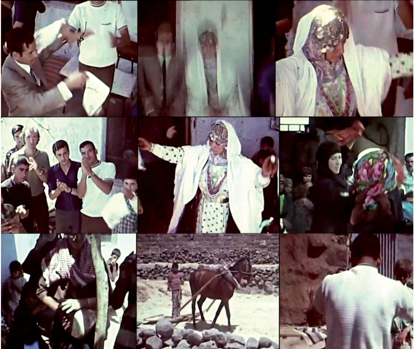
PAGES 32-33 The Space Between the Seconds , 2018 vue de l'exposition / exhibition view