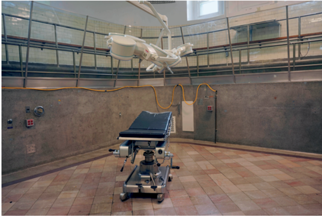
Gabor Szilasi Bloc opératoire (1924) / Operating theatre (1924), 29 mars, 2017 91 × 137 cm