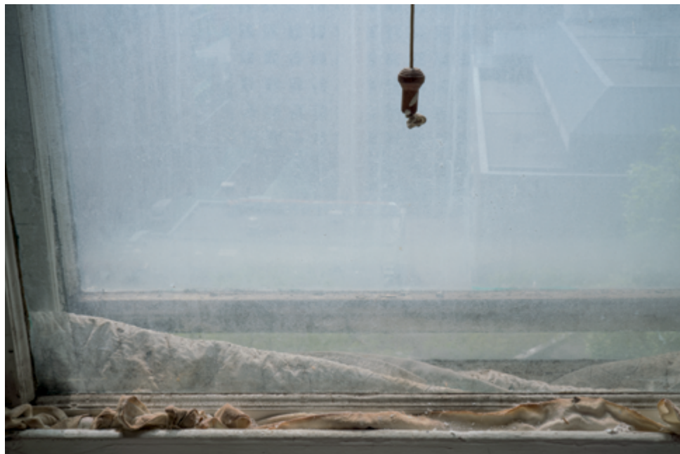
Raymonde April Détail d'une fenêtre, Hôpital Royal Victoria / Detail of a Window, Royal Victoria Hospital, 2017 91 x 137 cm