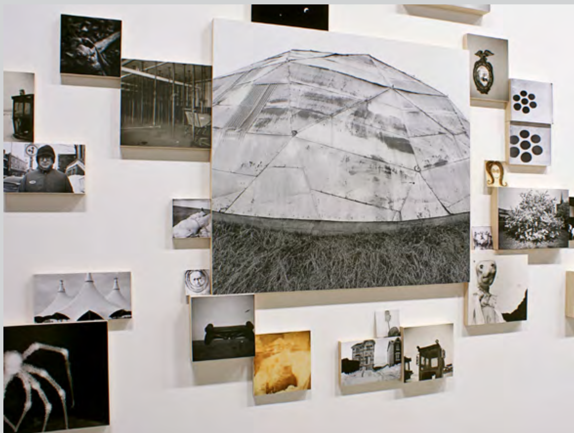
Vues d'exposition de Visites libres , 2013, épreuves argentiques et tirages au jet d'encre