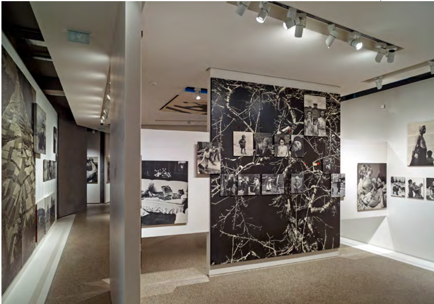
Family of Man , 1994, vues de l'exposition / exhibition views, Château de Clervaux, Luxembourg