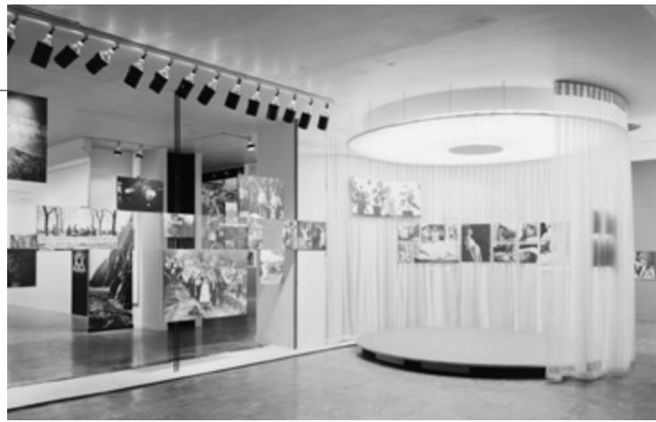
Family of Man , 1955, vue de l'exposition / exhibition view, Museum of Modern Art (MoMA), New York, photo: Ezra Stoller, Esto