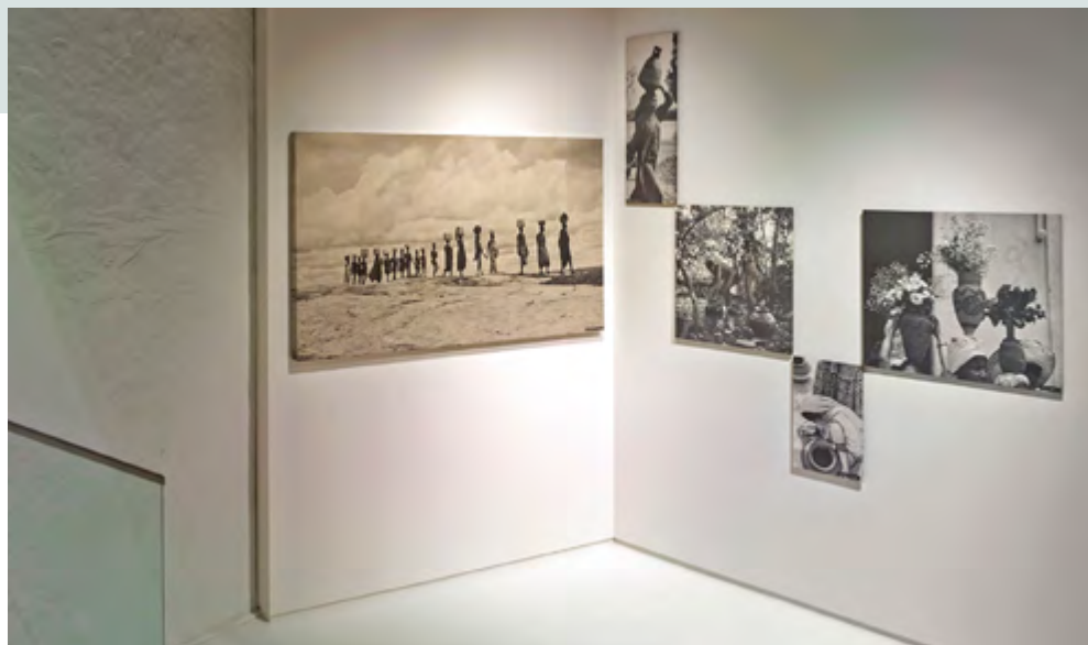
Family of Man , 1994, vue de l'exposition / exhibition view, Château de Clervaux, Luxembourg

travail et des références de Steichen, l'exposition contribue dans sa forme actuelle à faire l'expérience d'une légende jusque-là archivistique. Elle permet de repenser l'immersion du parcours sans ses enjeux coercitifs et de considérer la proposition visuelle comme une œuvre globale ; Family of Man se regarde pour l'exposition qu'elle est. Un exercice auquel ne peut prétendre New Topographics , avec ses moyens formats noir et blanc alignés sèchement, ce refus de s'abandonner aux effets. Ici, la démarche des photographes prévaut sur le discours du commissaire. L'étonnement de New Topographics réside non pas dans son éloquence formelle mais, bien au contraire, dans sa réticence visuelle presque outrée. Cérébrale, New Topographics se refuse à diriger le spectateur, laissant son intelligence tisser les liens avec le spectateur-témoin, tandis que Family of Man orchestre le bon sens populaire quitte à tout niveler, les œuvres y étant presque secondaires. Elles sont surtout des images.