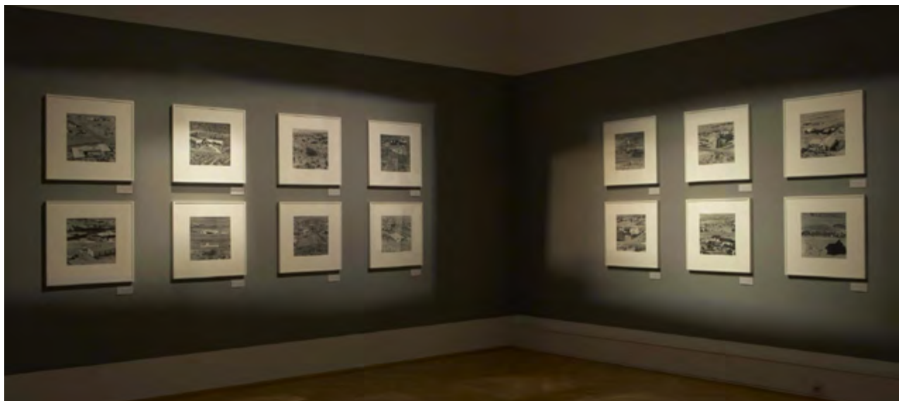
HAUT ET BAS / TOP AND BOTTOM: New Topographics: Photographs of a Man-Altered Landscape, 2010-2011, vues de l'exposition / exhibition views, Landesgalerie, Linz, Autriche, exposition organisée par / exhibition organized by the Center for Creative Photography, Tucson, Arizona, et / and the George Eastman House, Rochester, N. Y., CENTRE: New Topographics: Photographs of a Man-Altered Landscape, 1975, vues de l'exposition / exhibition views, George Eastman House, Rochester, N. Y.