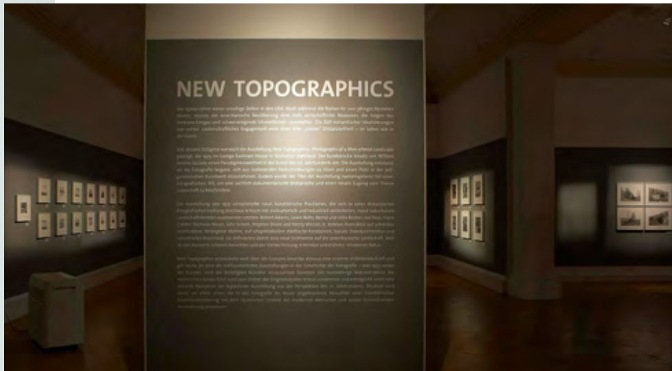
New Topographics: Photographs of a Man-Altered Landscape, 2010-2011, vue de l'exposition / exhibition view, Landesgalerie, Linz, Autriche, exposition organisée par / exhibition organized by the Center for Creative Photography, Tucson, Arizona, et / and the George Eastman House, Rochester, N. Y.

réside dans cette expérience inédite, comme c'était le cas avec When Attitudes Become Form en 2013. Pour New Topographics , l'expérience est moins concluante en raison de sa forme quasiment anti-expositionnelle ; elle fonctionne essentiellement sur un mode archéologique plus nostalgique.