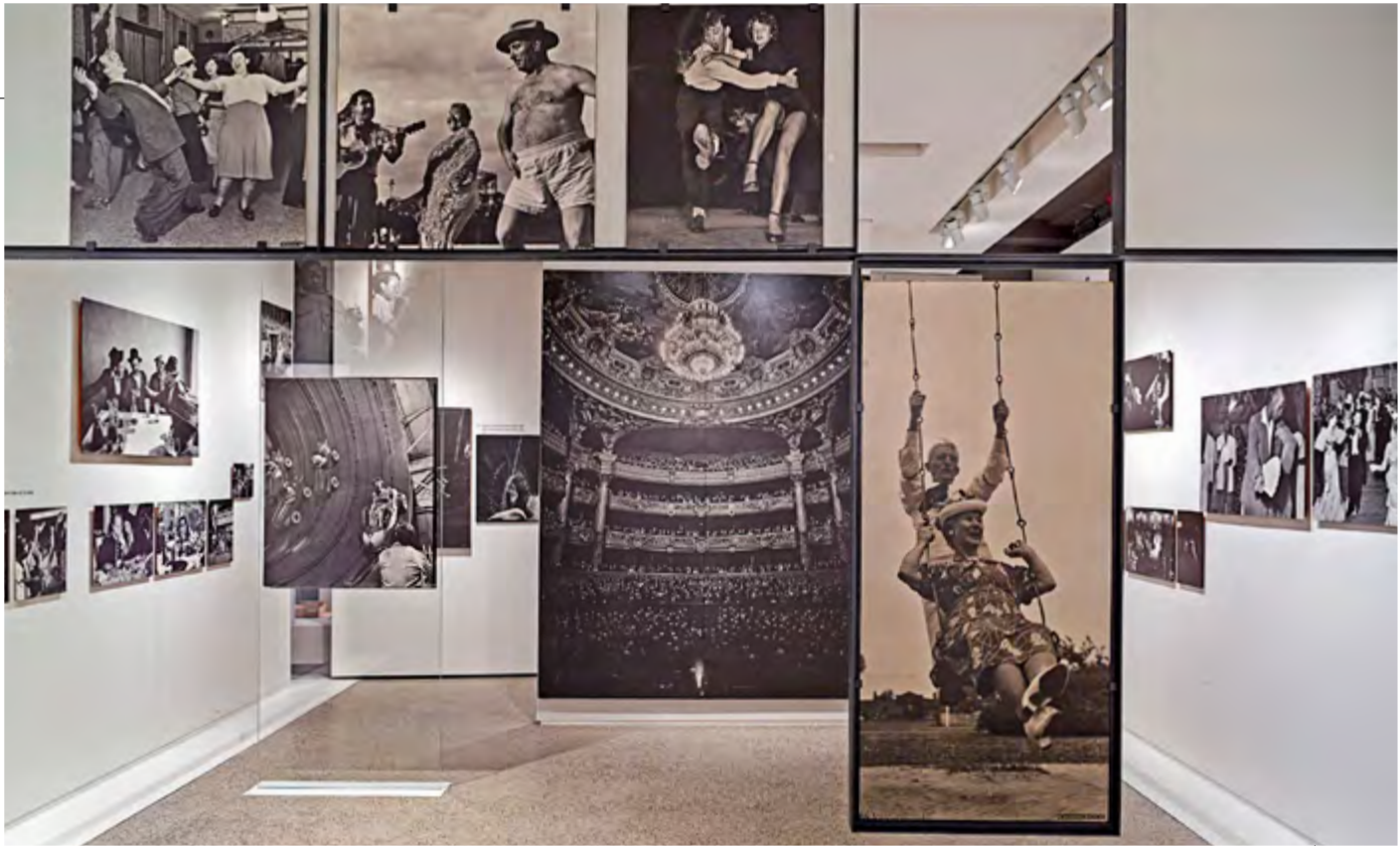
Family of Man , 1994, vue de l'exposition / exhibition view, Château de Clervaux, Luxembourg

Alfred Eisenstaedt , Time & Life Pictures, Getty Images; Jack Delano , Farm Security Administration, Library of Congress; Eugene Harris , photographie populaire / Popular Photography; Leon Levinstein , Howard Greenberg Gallery, New York; Toni Frissell , Library of Congress; Nina Lee , Time & Life, Getty Images; Garry Winogrand , The Estate of Garry Winogrand, Fraenkel Gallery, San Francisco, de la collection / from the collection Family of Man, Château de Clervaux, Luxembourg