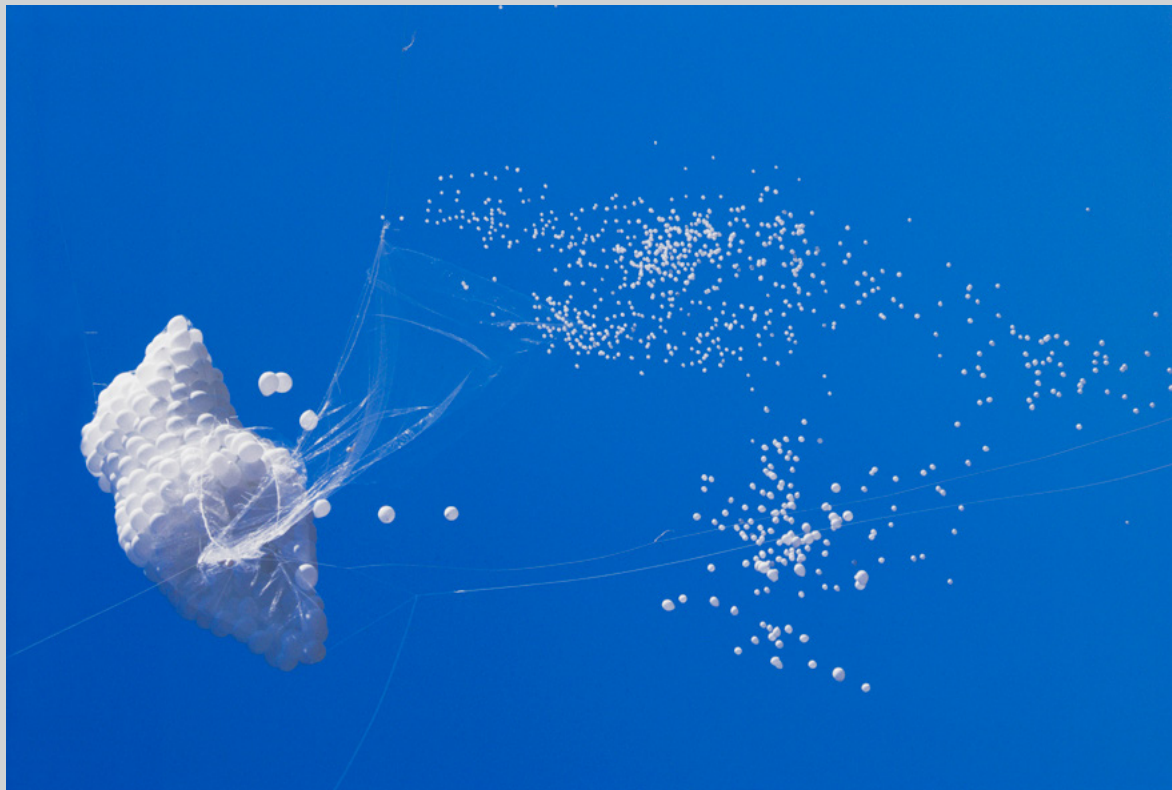
Alfredo Jaar, We Wish To Inform You That We Didn't Know , 2010, permission de l'artiste