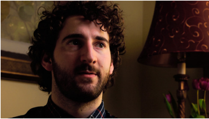
Jennie Suddick , Land/Slide , 2013, installation (interviews of different generations of Markham citizens about their favourite walks and memories of landscape / entrevues avec différentes générations de citoyens de Markham à propos de leurs promenades favorites et de leurs souvenirs de paysages)