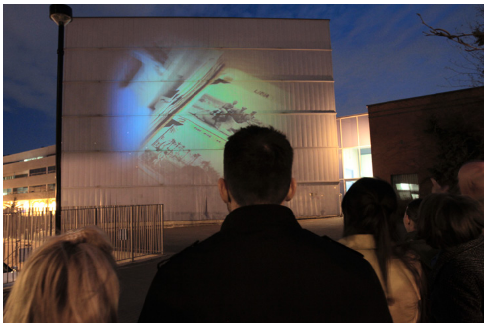
Patricio Davila & Dave Colangelo, 30 Moons, Many Hands , 2013, video projection / projection vidéo

tells the story of the massive industrialization of the meat industry in Canada, a hidden history of carnage. The small and large images, like the audio projects, feature the flexibility and portability made possible through advances in digital imaging and projection.