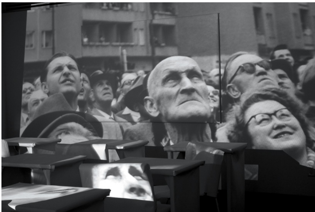
Michael Snow, from the series / de la série TAUT , 2012

A new generation of artists are using media technologies to explore these interfaces and the meanings of translocality, public spaces, and mobile networks that are distinct configurations grounded in place – indeed, often several places and several times at once. How do such art practices function as forms of public art and in site-specific settings while serving as a tool for enhancing communication and forms of media art?