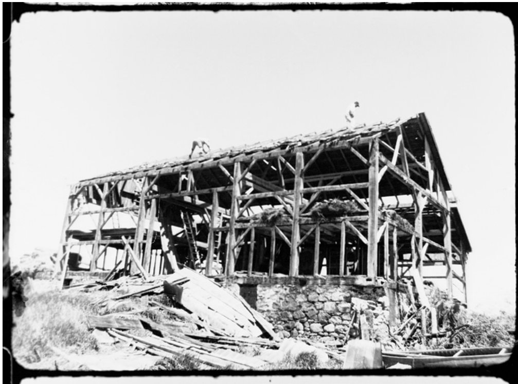
Philip Hoffman, Digital film still / image numérique tirée de All Fall Down, Southern Ontario Barn , 2009, 94 min