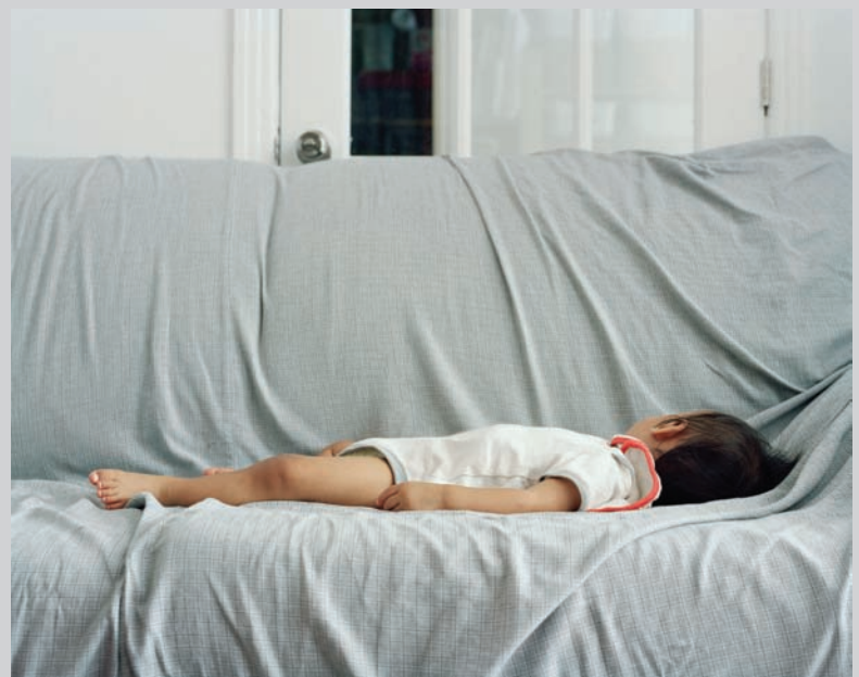
Shaore Lies on Futon , 2011, inkjet print, 101,6 x 127 cm

— James D. Campbell is a writer on art and independent curator based in Montreal. The author of over 100 books and catalogues on contemporary art and artists, he contributes frequently to visual arts publications across Canada and abroad. —