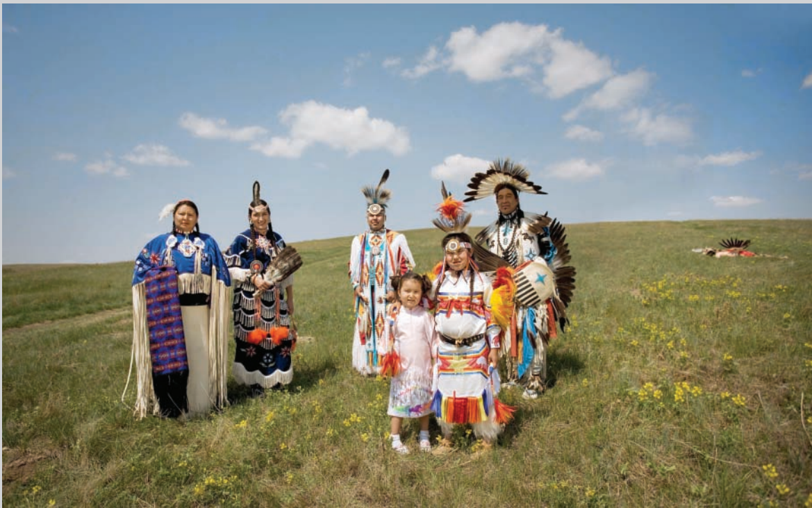
Terrance Houle, Landscape #2 , 2007, photograph, 96 x 60 cm

told me, "I had one guy in Vancouver go, 'You guys are just like in my Grade 10 textbook!' And we're like, 'Yes! He got it! One person got it!'" This reaction to the absurdity of such a sight is necessary for the performance.