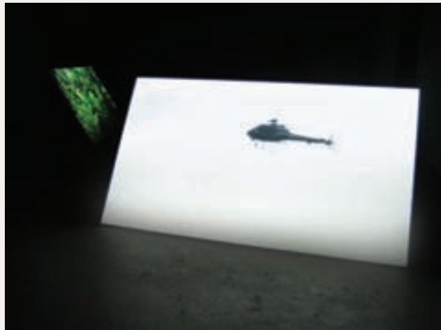
PAGES 21-25 EN BAS / BOTTOM R for Real , 2008, installation vidéo / video installation (HD transféré sur DVD, 3 canaux, couleur, son stéréo / HD transferred to DVD, 3 channels, colour, stereo sound), 3 x 3 min.