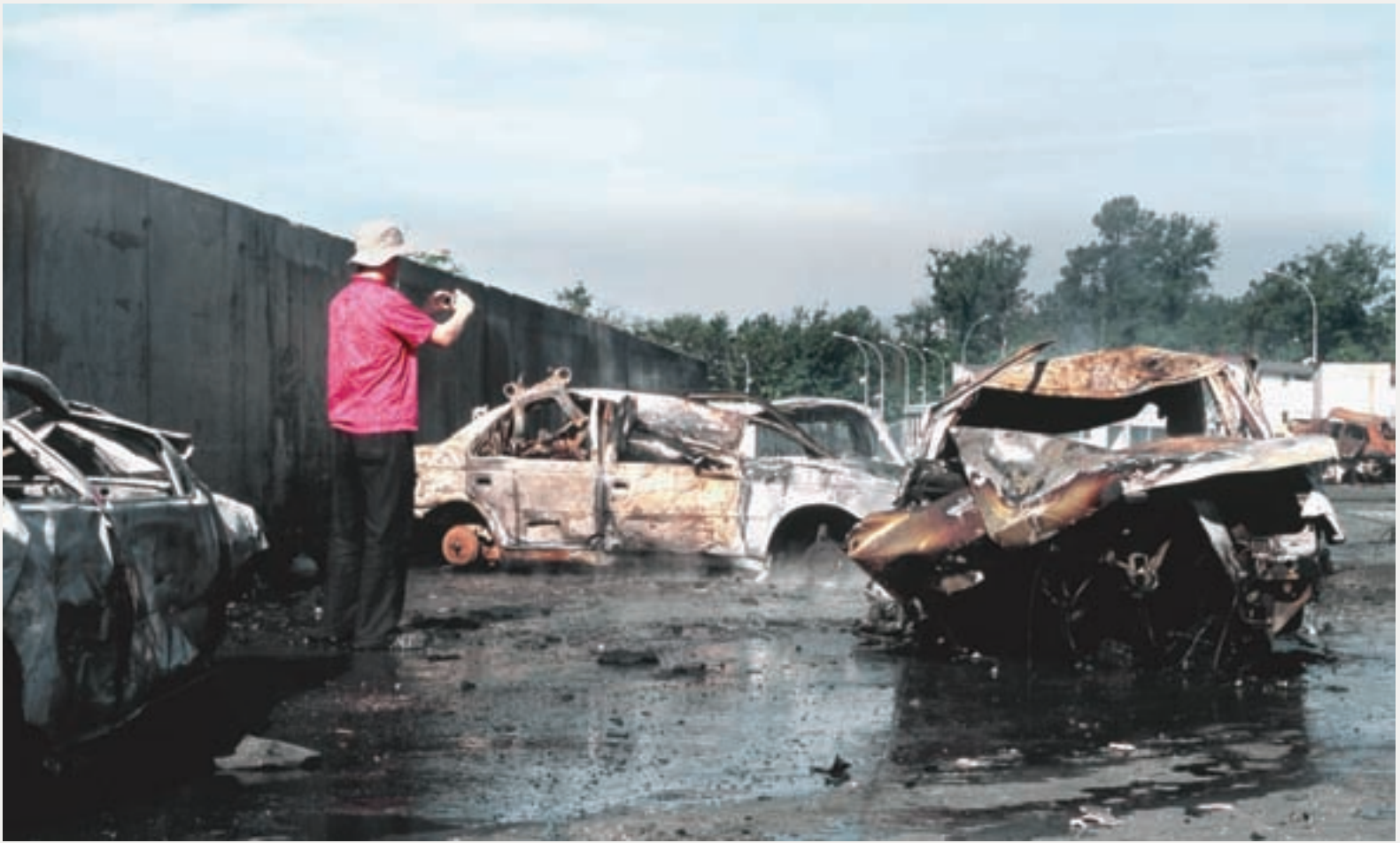
PAGES 21-26 R for Real , 2008, série de quatre photographies / series of four photographs, épreuves numériques couleur / digital colour prints, 62,5 x 104 cm each / ch.