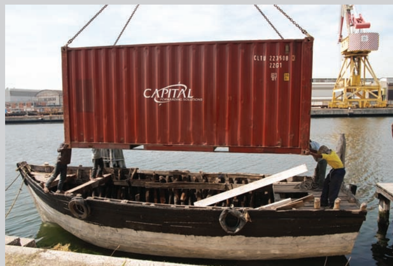
Paolo W. Tamburella, Djahazi , installation, 2009, Pavillon des Comores, 53 e exposition internationale d'art - La Biennale de Venise.

Près de Barcelone, des manifestants brandissant des affiches, en lettres géantes, contre la construction d'une bretelle d'autoroute ; le musée d'un vieil original thésaurisant ces choses qu'on jette ; sur Google, un zoom, par satellite, montrant littoraux, villes, quartiers ; l'argent, envisagé comme rituel anthropologique ; des textes de philosophie politique en