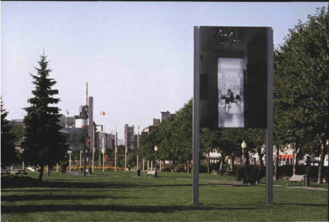
PAGE 18 Raymonde April, Arbre , 2001, vue d'installation, 2,46 x 3,66 m, MAU, Montréal