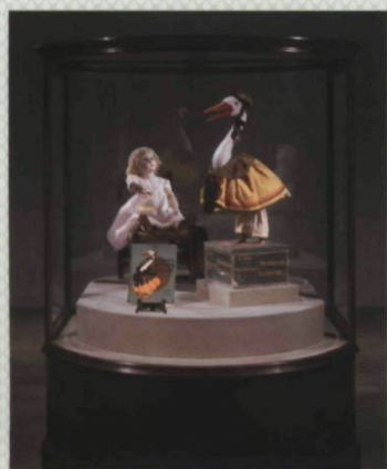
Predators & Prey , 2005, Toronto

ABOVE/EN HAUT André Kertész (1894-1985) The House of Silence , 1928