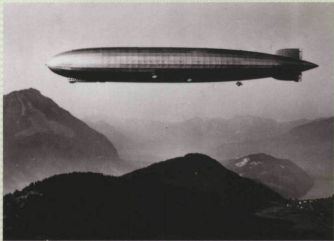
PAGE 16 Predators & Prey (The Zeppelin Project) , 2002-2005 Zeppelin – Weltfahrten, Books I and II, 1933, Bilderstelle Lohse, Dresden (1 st Edition)