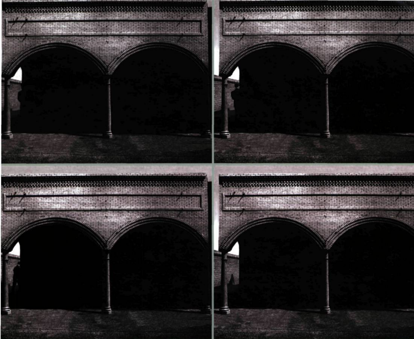
Man under arches , quatre vues fixes tirées d'une projection en noir et blanc, 2000