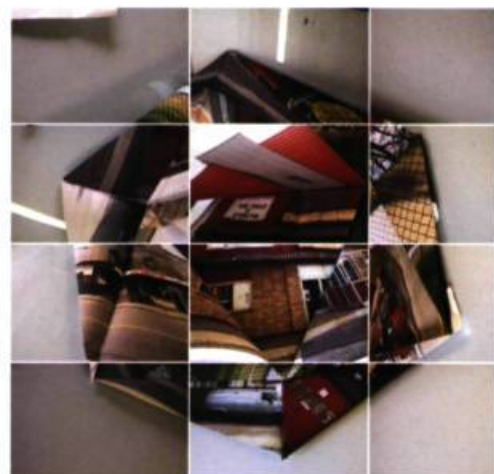
Polyèdres (Cube) impression numérique 104,5 x 91,5 cm 2004