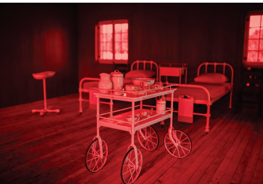
Lazaret du secteur est de Grosse-Île et salle baignée de lumière rouge destinée aux gens atteints de la variole.