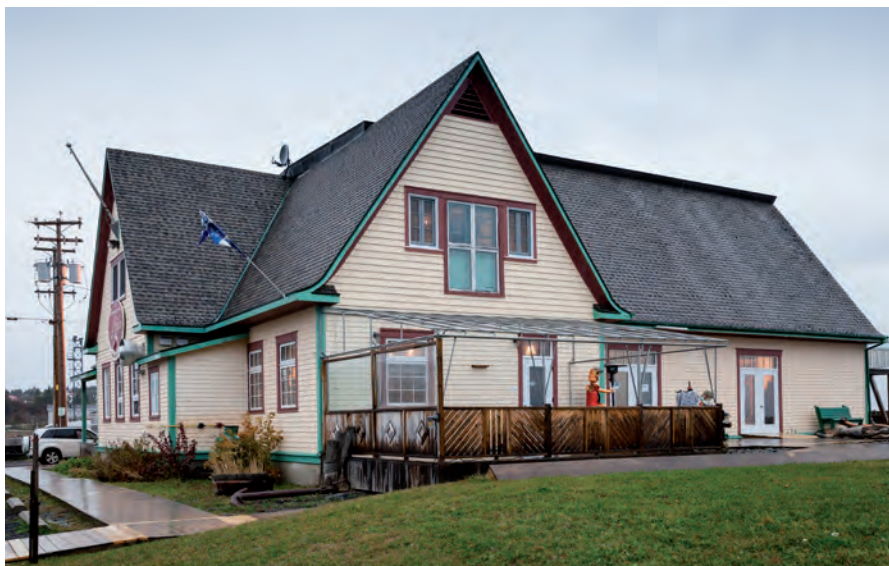
Des citoyens attachés à l'ancien entrepôt frigorifique de L'Anse-au-Griffon l'ont sauvé de la démolition et transformé en centre culturel. On le voit ici avant (en haut) et après sa restauration.