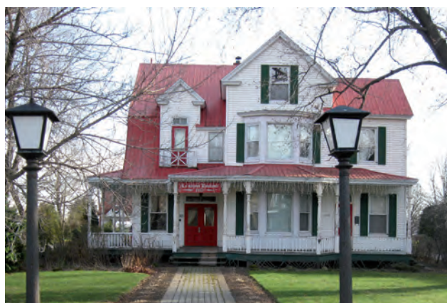
Maison de Pierre Bleau avant (en bas) et après la restauration de ses éléments extérieurs.

Au moment de l'achat des lieux, M. Bleau était ingénieur civil pour la Ville de Montréal et sa femme, urbaniste. Leurs