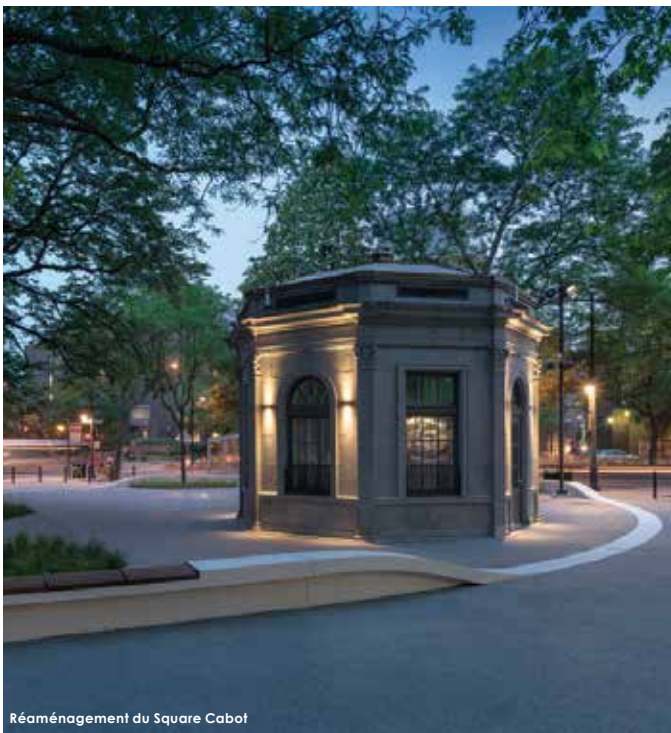
Réaménagement du Square Cabot