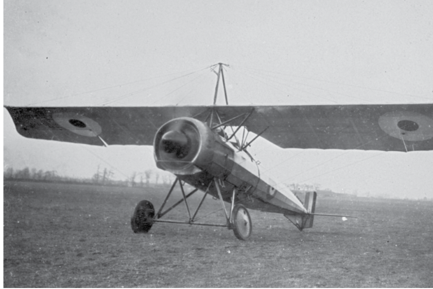
Le Musée de l'aviation et de l'espace du Canada expose le plus vieux avion toujours existant à avoir volé au Canada : le monoplane de Borel-Morane, conçu en France en 1911.

Si les gros appareils volent la vedette (et l'espace) dans les hangars du Musée, l'institution compte aussi des éléments plus discrets, comme des livres, des uniformes et une collection de magazines spécialisés sur l'aviation civile et militaire au pays. « Nous avons probablement ce qui est la meilleure bi-