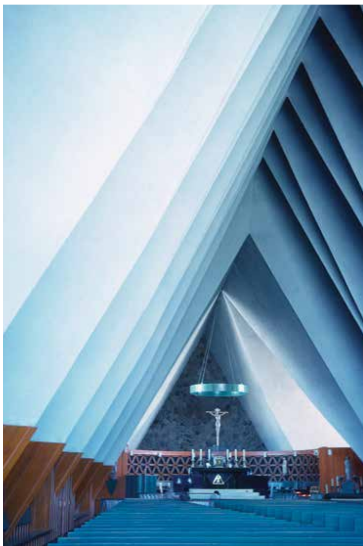
Comme plusieurs lieux de culte modernes, l'église La Bible Parle évoque une tente. Photo : Lévis Martin, 1963