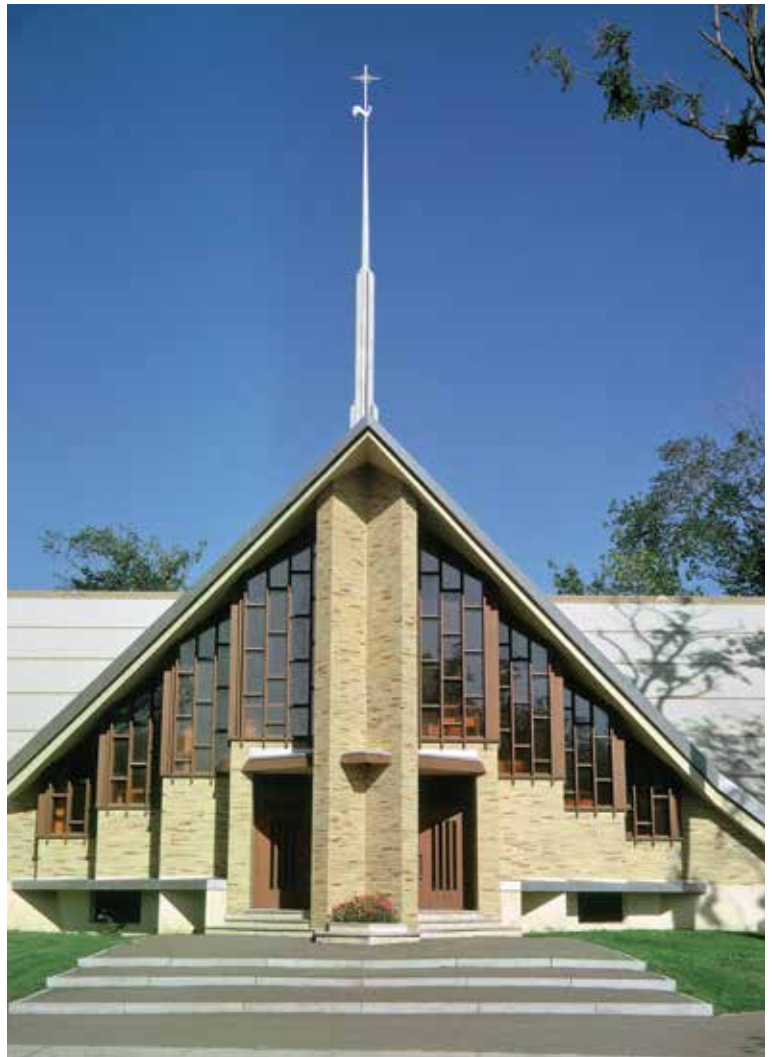
L'église Notre-Dame-du-Bel-Amour dans l'éclat de sa jeunesse, telle que dessinée par Roger D'Astous