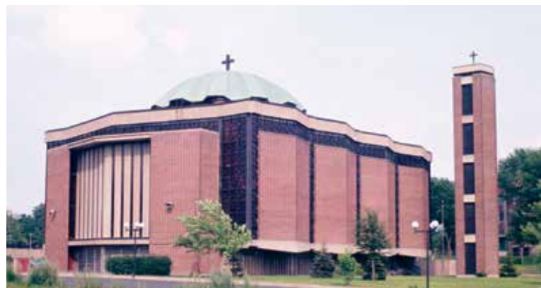
Les composantes architecturales de la cathédrale Saint George's Greek Orthodox se juxtaposent plutôt que de s'emboîter.