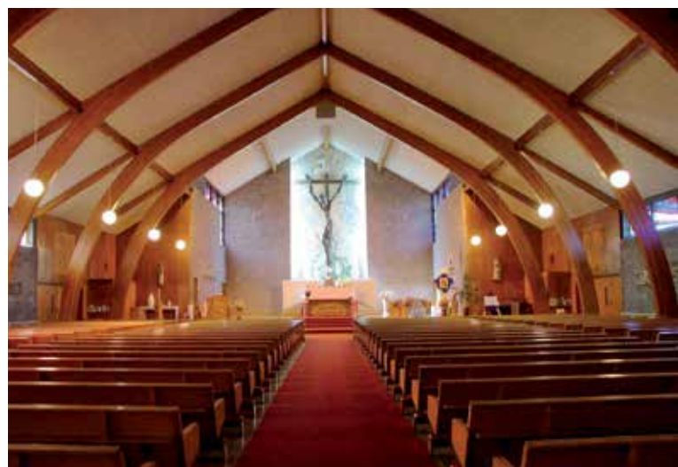
La charpente en bois lamellé-collé de l'église Christ-Roi : une première au Québec