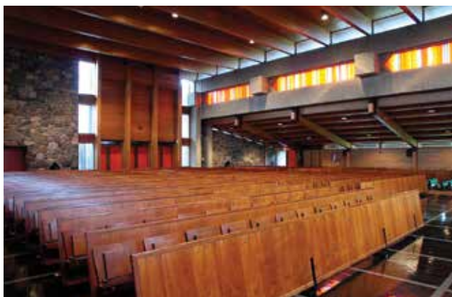
La nef de l'église Saint-Maurice-de-Duverney est éclairée par un vitrail de Jean-Paul Mousseau.