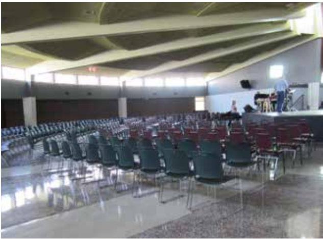
La nef semi-circulaire de l'église Saint-Augustin convient parfaitement à un usage scénique.