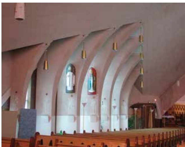
Détail des piliers latéraux de la cathédrale Saint-Jean-Baptiste et du chemin de croix signé Jean-Paul Charland