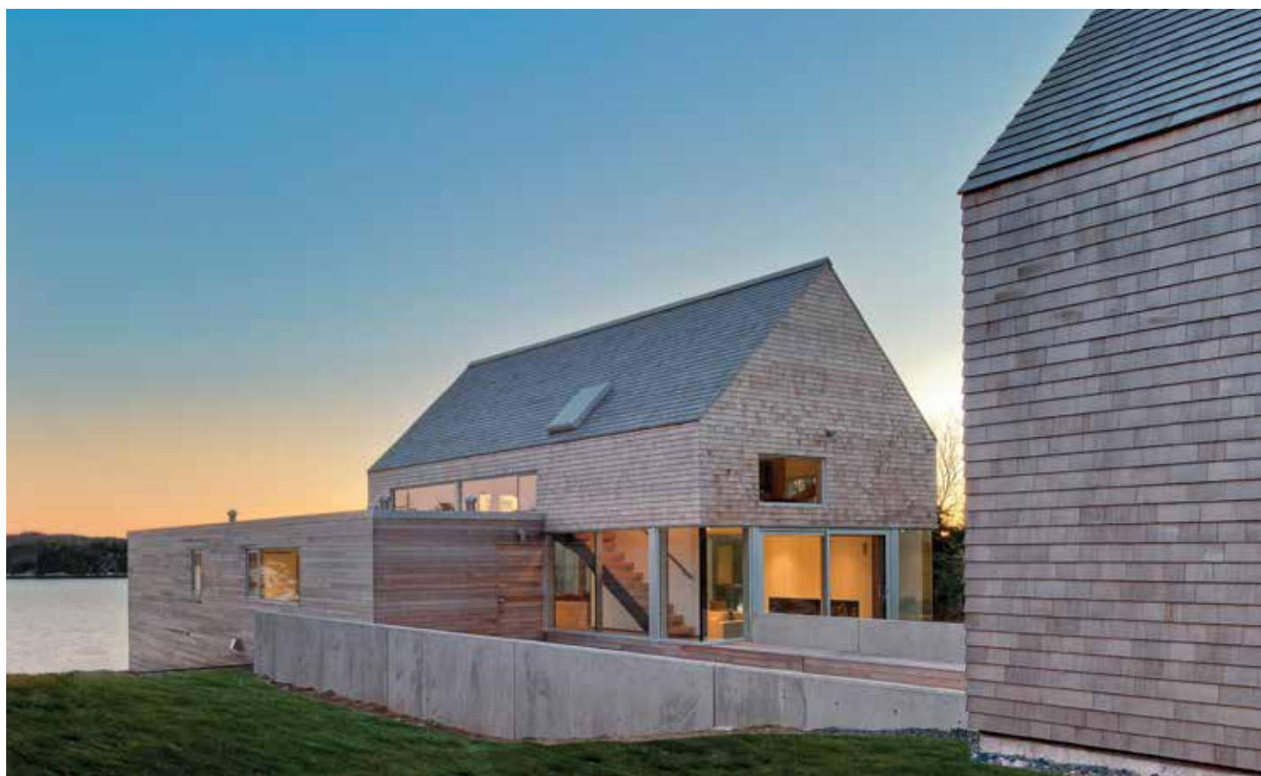
Le bardeau de bois peut être utilisé dans des projets contemporains comme la maison Martin-Lancaster, conçue par MacKay-Lyons Sweetapple Architects Limited, en Nouvelle-Écosse.