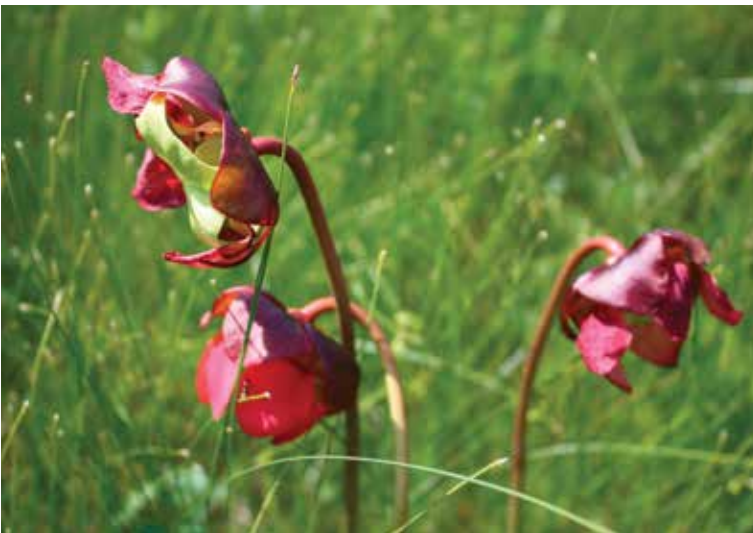
Parmi les noms officialisés au cours des dernières années figure celui du lac de l'Alicotache. Ce lieu est bordé de sarracénies, une plante insectivore appelée alikutash dans la langue innue.

Les lieux-dits jouent un rôle particulier à cet effet. Ces dénominations spontanées, utilisées par les populations locales, ont un lien significatif avec l'endroit qu'elles désignent. Sauf qu'elles ne sont pas officialisées en général. « Souvent, elles sont maintenues sur la base de l'oralité, précise M me Bouvet. La culture autochtone est particulièrement concernée. Malheureusement, si aucun effort n'est fait pour colliger ces appellations, elles risquent fort de disparaître, entraînant avec elles une continuité entre le passé et le présent. »