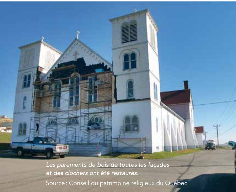
Les parements de bois de toutes les façades et des clochers ont été restaurés.