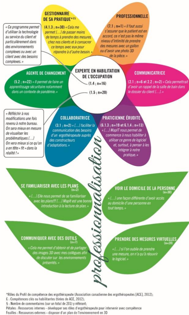
Figure 2. Agir compétent des personnes étudiantes en ergothérapie lors d'une démarche d'adaptation domiciliaire en utilisant MapIt

Conflits d'intérêts : Les autrices et auteurs déclarent n'avoir aucun conflit d'intérêts personnel ou financier découlant de ce manuscrit. MapIt est une ressource éducative libre.