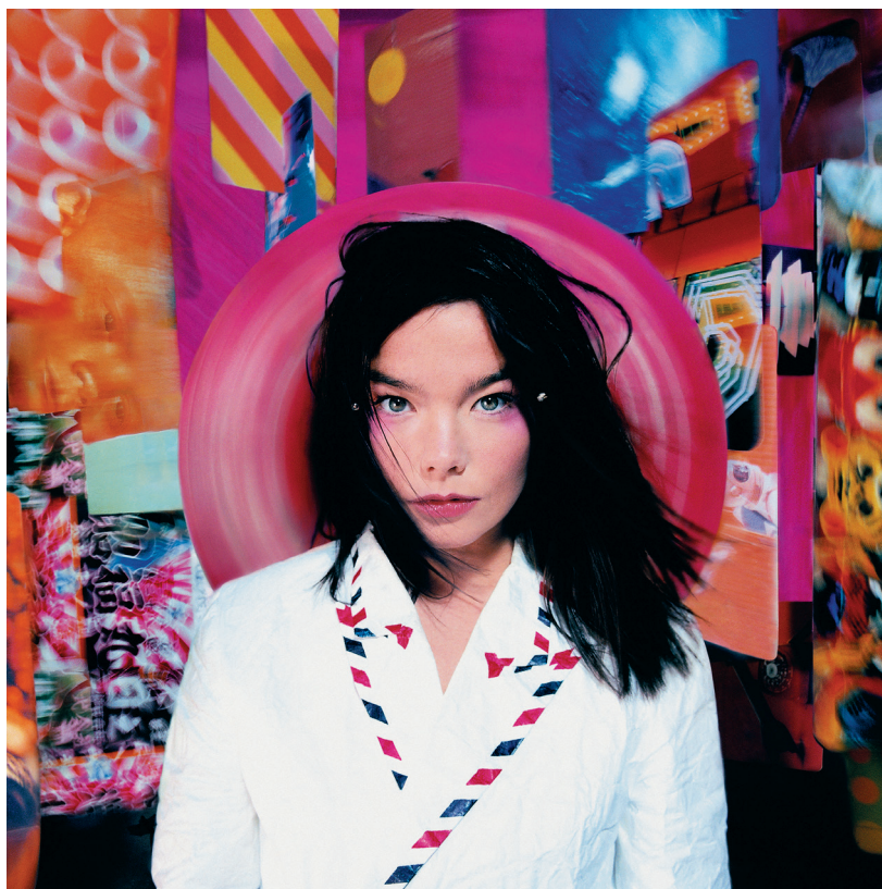
Couverture de l'album Post (1995).

10. Pour faire un don : https://revuecircuit.ca/apropos/dons (consulté le 6 août 2021).