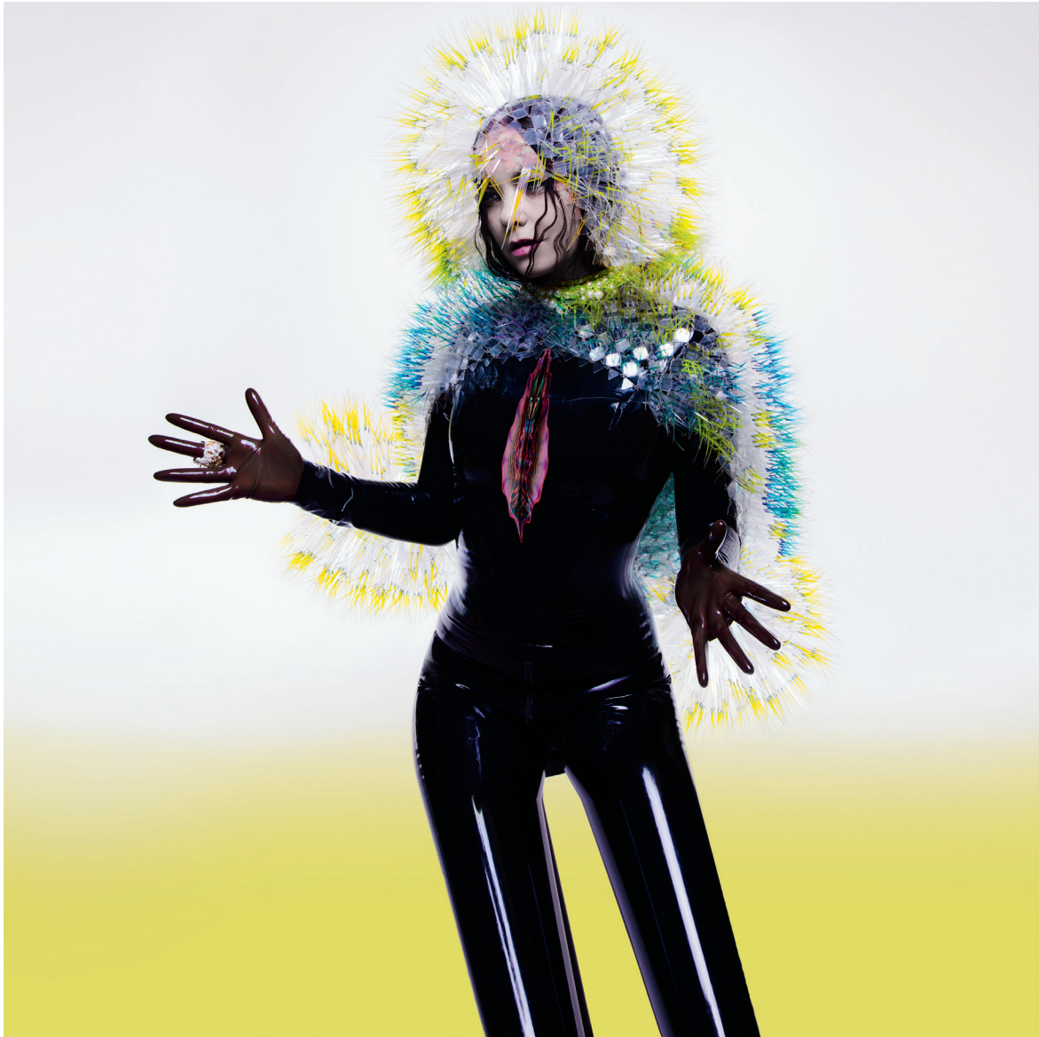
Couverture de l'album Vulnicura (2015).