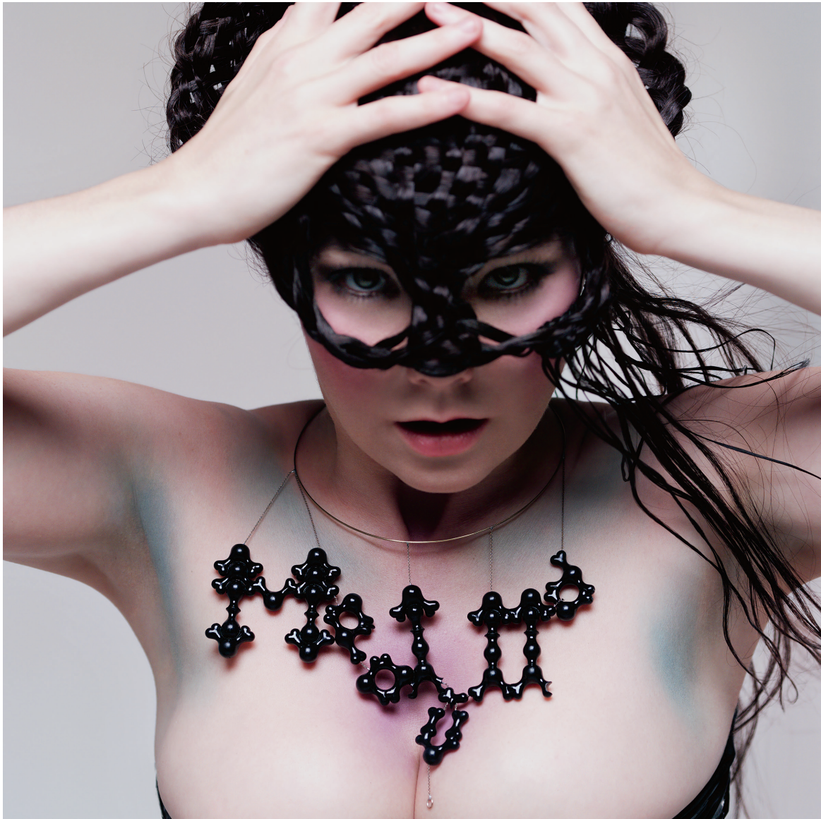
Couverture de l'album Medúlla (2004).