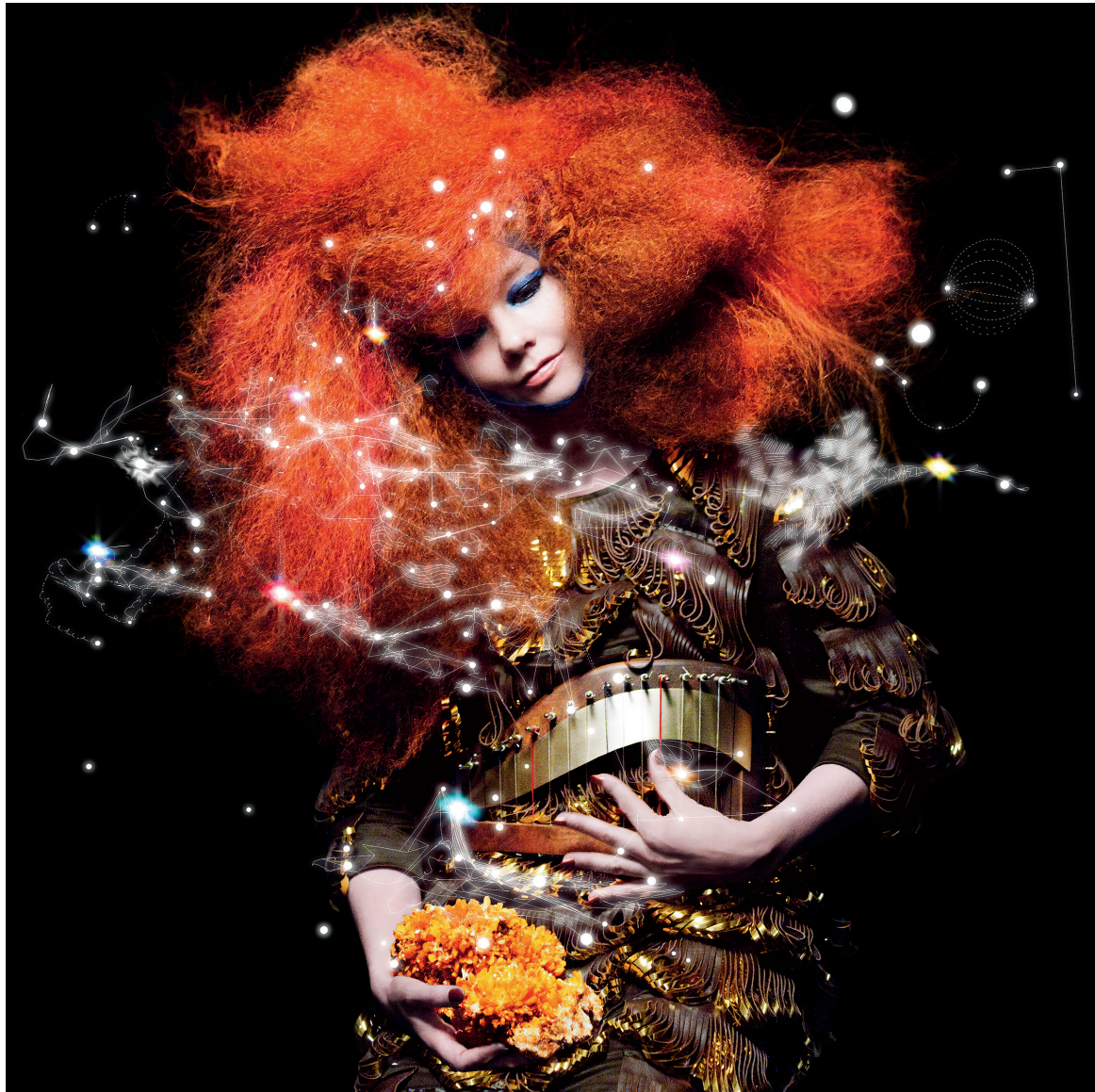
Couverture de l'album Biophilia (2011).