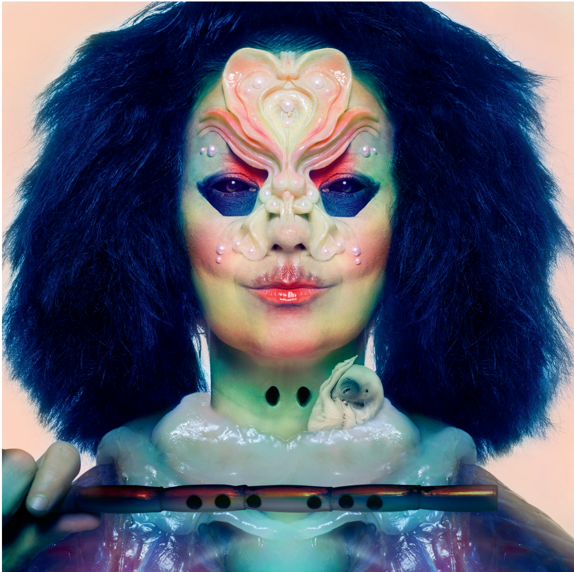
Couverture de l'album Utopia (2017).