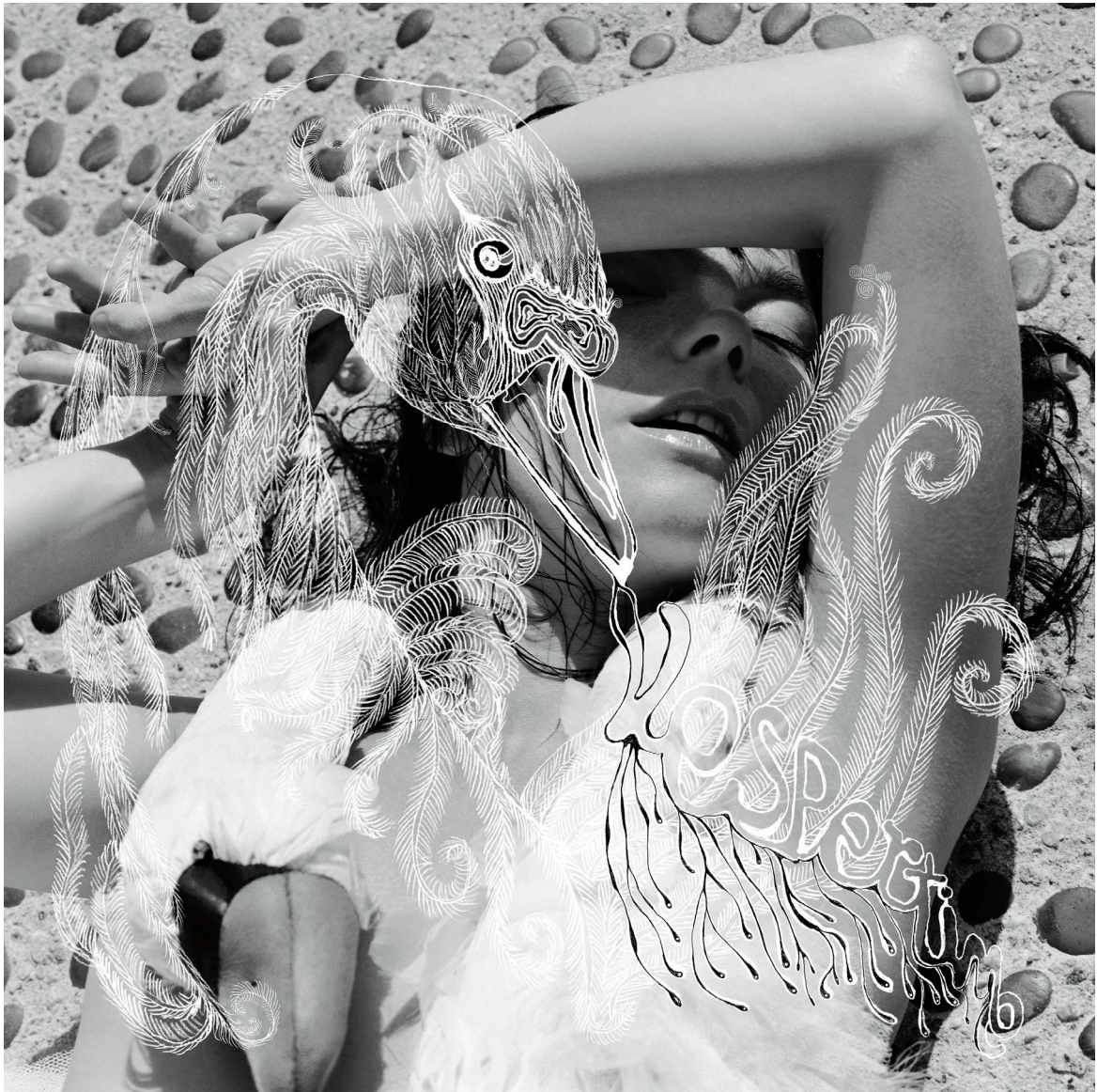
Couverture de l'album Vespertine (2001).