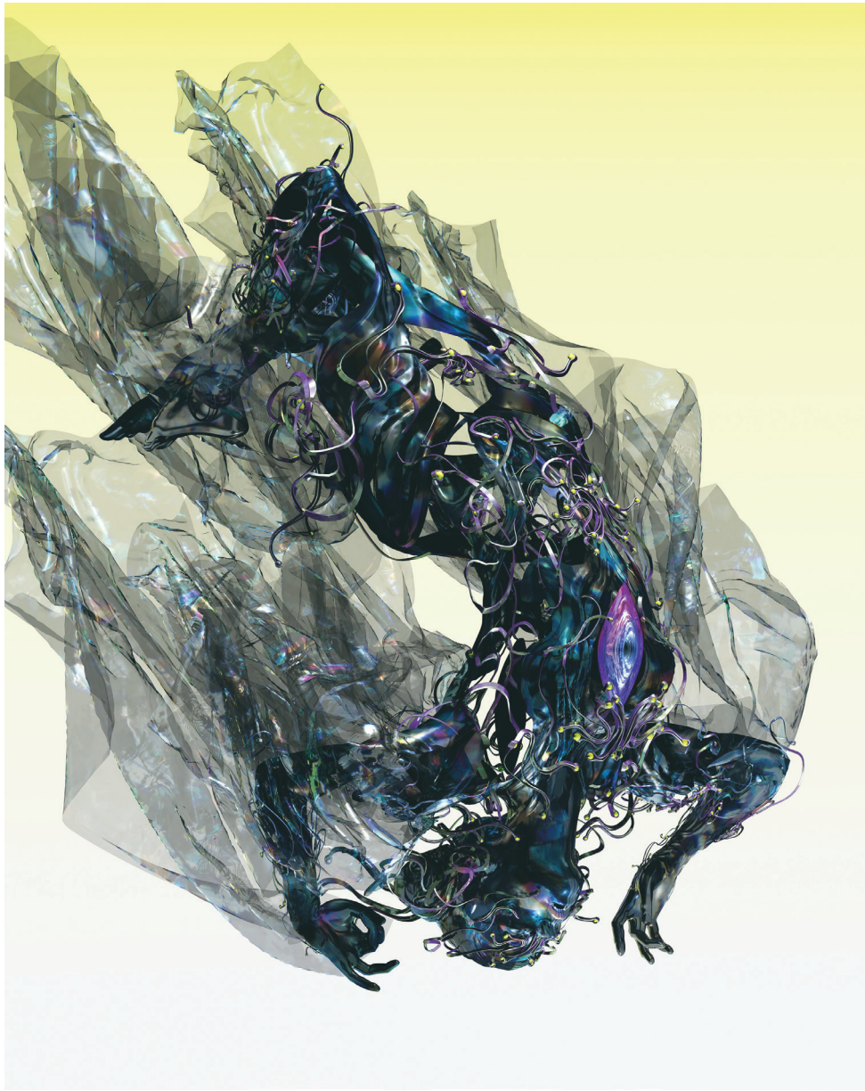
Björk, Family, 2016.