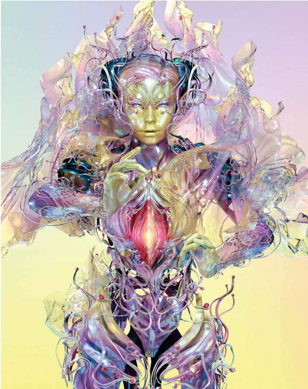
Björk, Family, 2016.