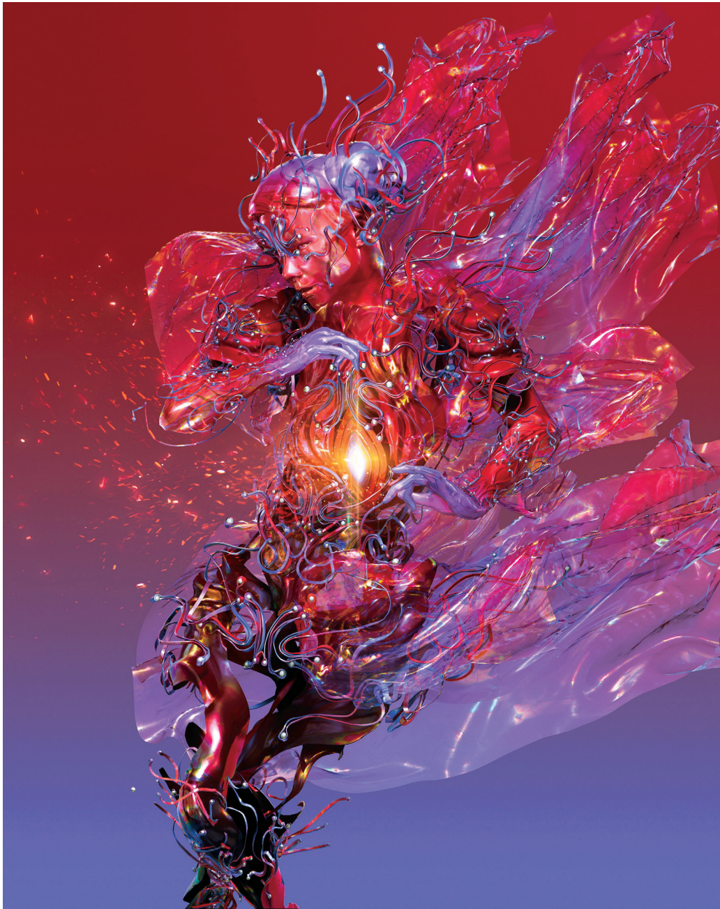
Björk, Family, 2016.