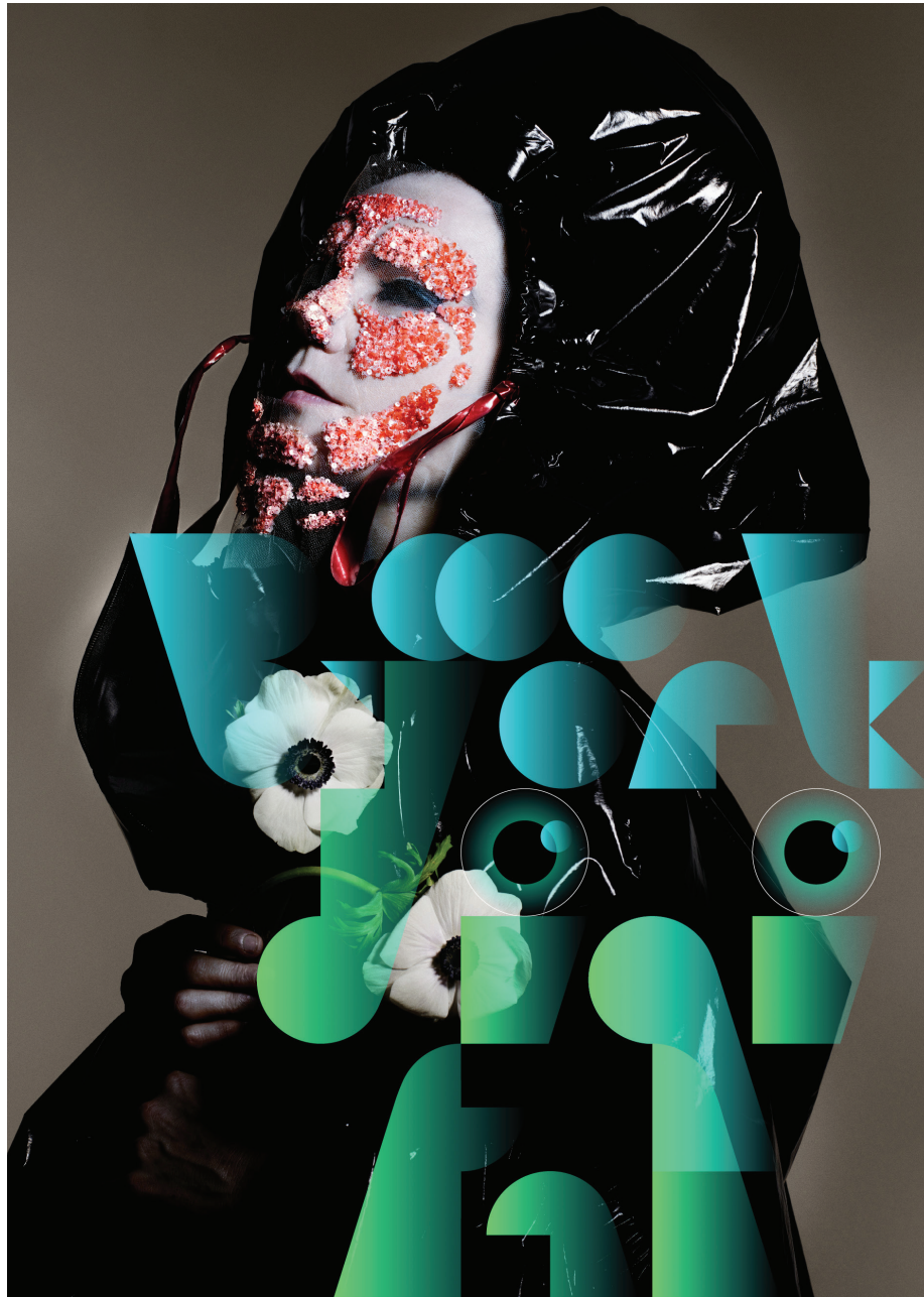
Affiche de l'exposition Björk Digital . Photo : Nick Knight ; typographie par M/M (Paris).