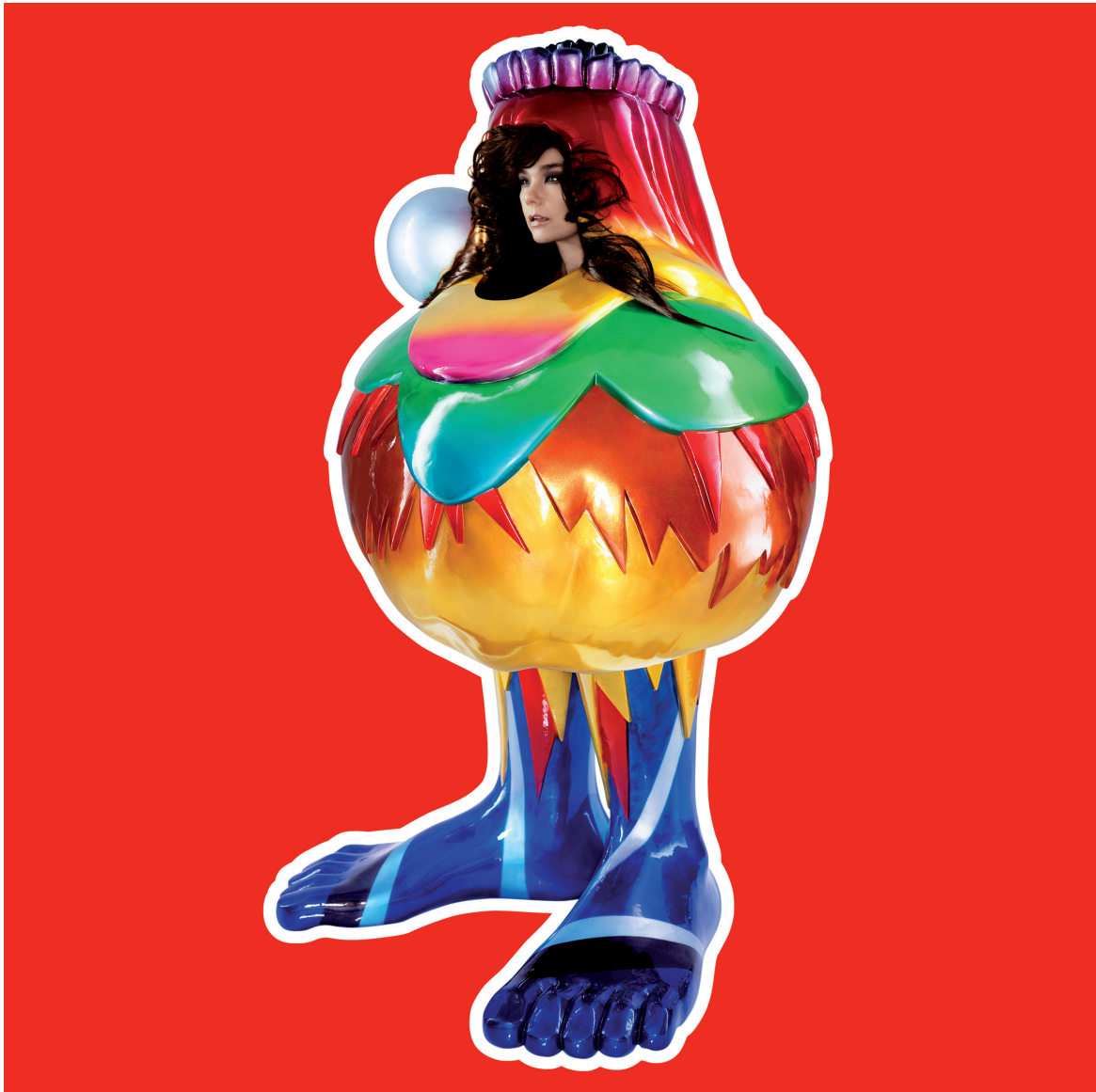
Couverture de l'album Volta (2007).