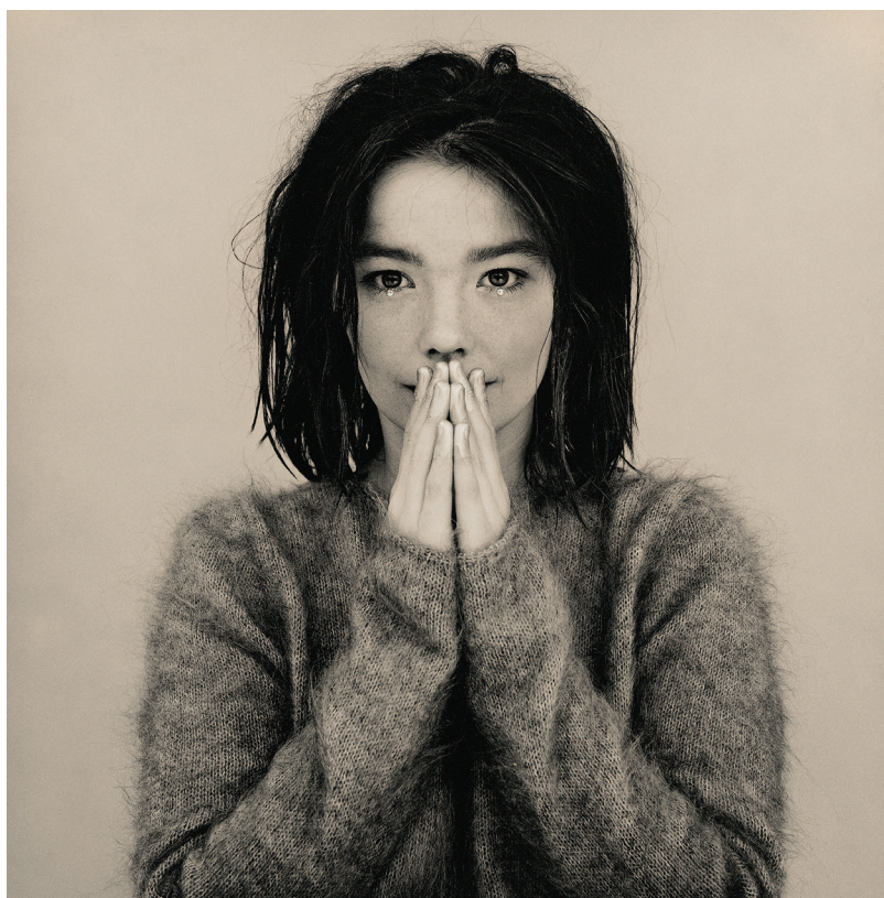
Couverture de l'album Debut (1993).