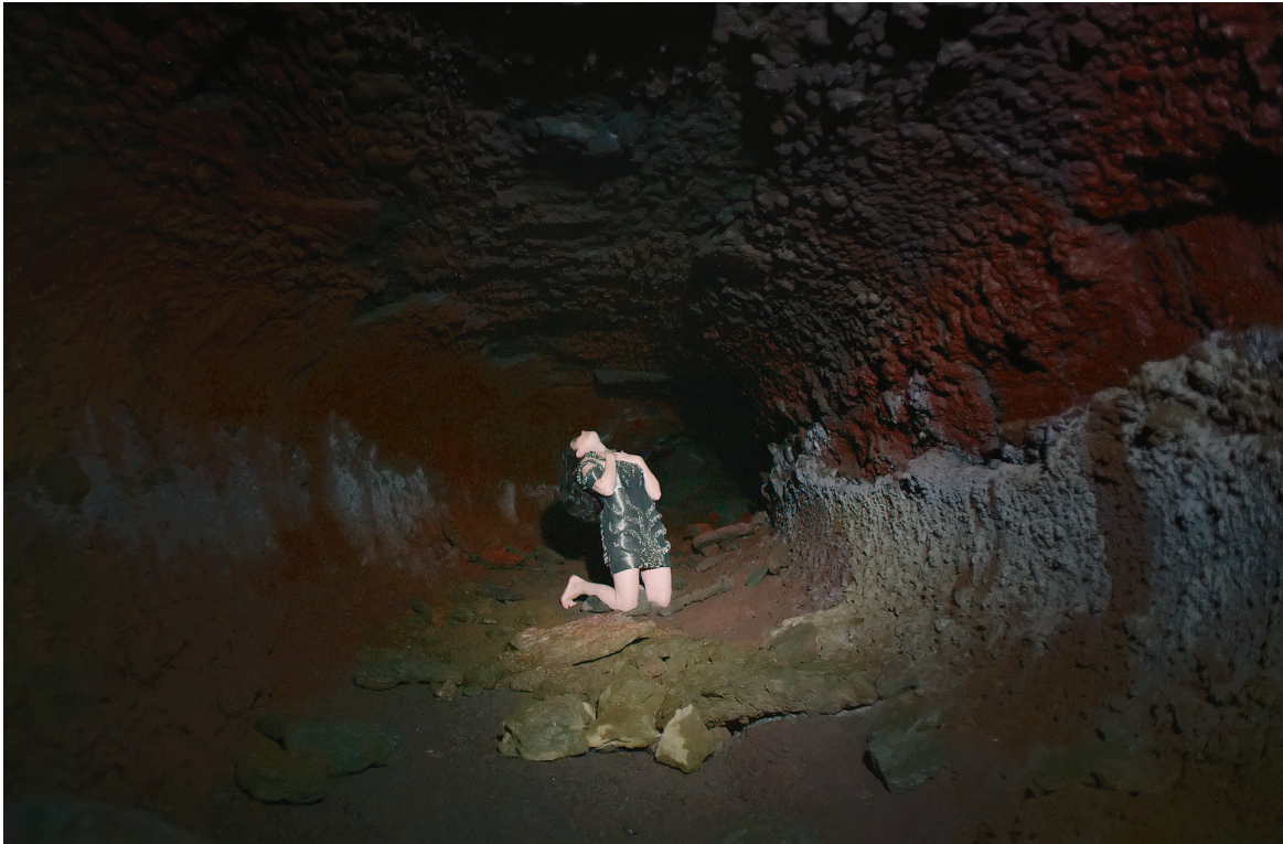
Détail d'une photographie tirée du vidéoclip de «Black Lake» ( Vulnicura , 2015). Image : Andrew Thomas Huang.