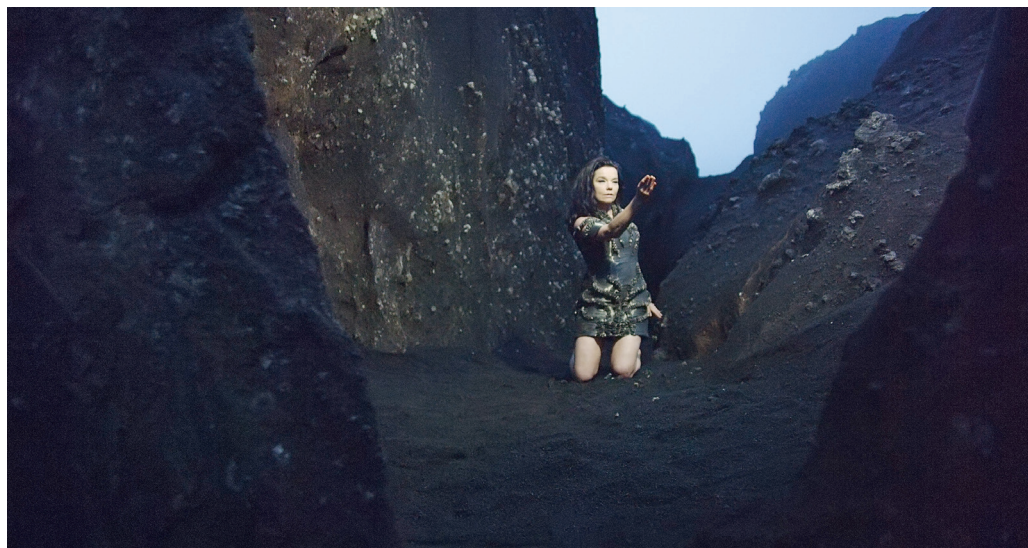
Photographie tirée du vidéoclip de « Black Lake » ( Vulnicura , 2015). Image : Andrew Thomas Huang.