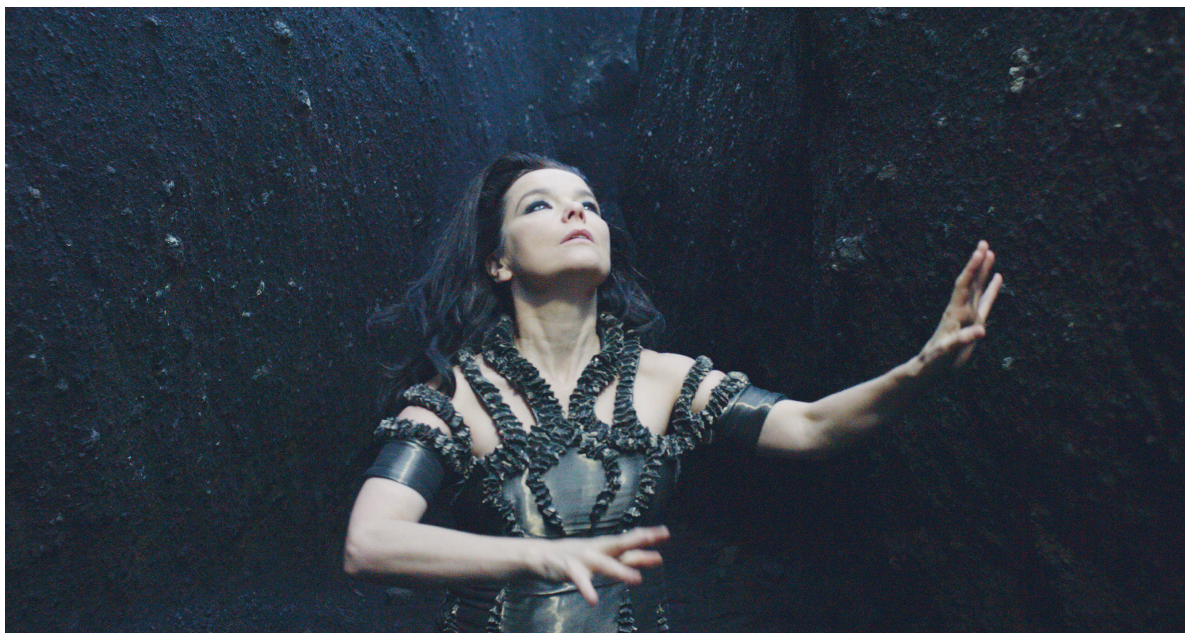
Photographie tirée du vidéoclip de «Black Lake» ( Vulnicura , 2015). Image: Andrew Thomas Huang.

9. Ouzounian was born in Beirut and spent most of her formative years in Canada. These essays recount her experience as a "virtual newcomer" returning to the city.