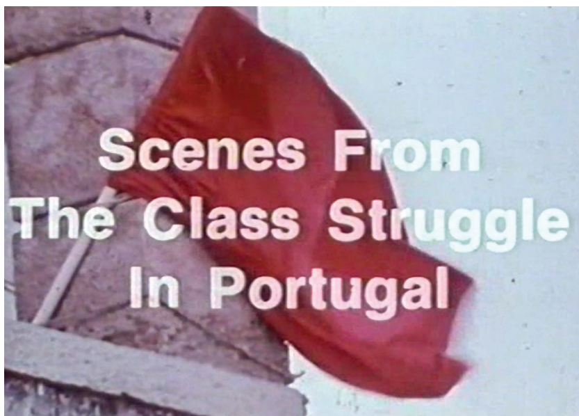
Figure 1. Scènes de lutte de classe au Portugal (Robert Kramer et Philip J. Spinelli, 1977).

Le rapport entre l'inscription du titre à l'écran et le drapeau filmé en plan large puis rapproché donne l'impression qu'il s'agit d'un seul et même motif, comme si la surimpression du titre venait se fondre par contact sur la zone de couleur rouge du drapeau, faisant disparaître le rapport entre l'avant-plan – le titre du film – et l'arrière-plan – le drapeau lui-même. Cette mise en relation permet d'inscrire de façon lisible le point de vue adopté par les réalisateurs