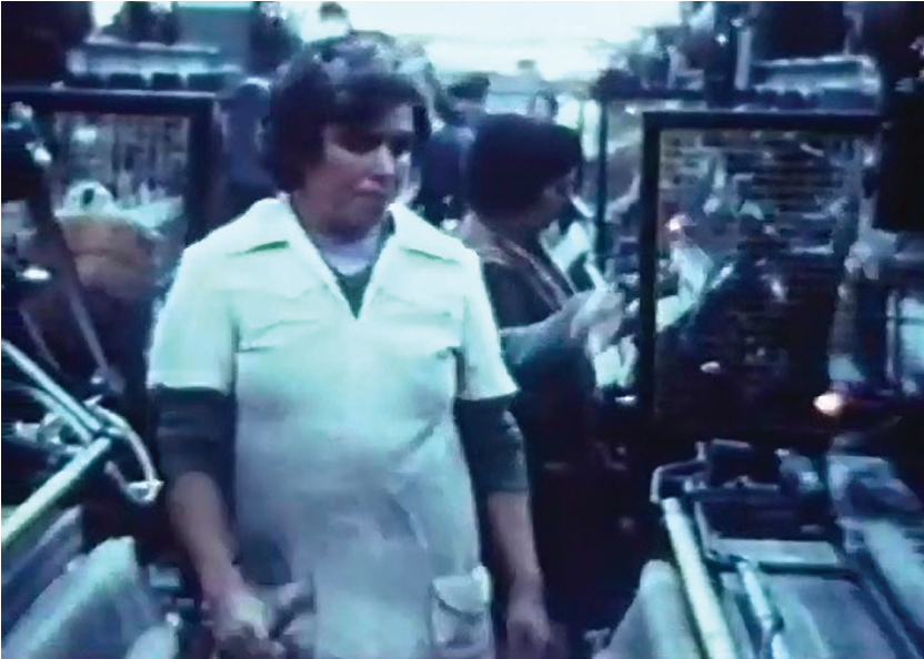
Figure 3. Scènes de lutte de classe au Portugal (Robert Kramer et Philip J. Spinelli, 1977).

plutôt que de chercher à individualiser les forces en présence. Le cadre procède par recadrages successifs et cherche à problématiser, dans l'image, le geste des corps au travail. Cette problématique du mouvement donne l'impression au spectateur d'être pris dans un tourbillon de sensations qui semble incapable d'installer l'individu dans l'espace, ce que le montage récupère en un geste abrasif qui coupe régulièrement dans le plan même de l'action.