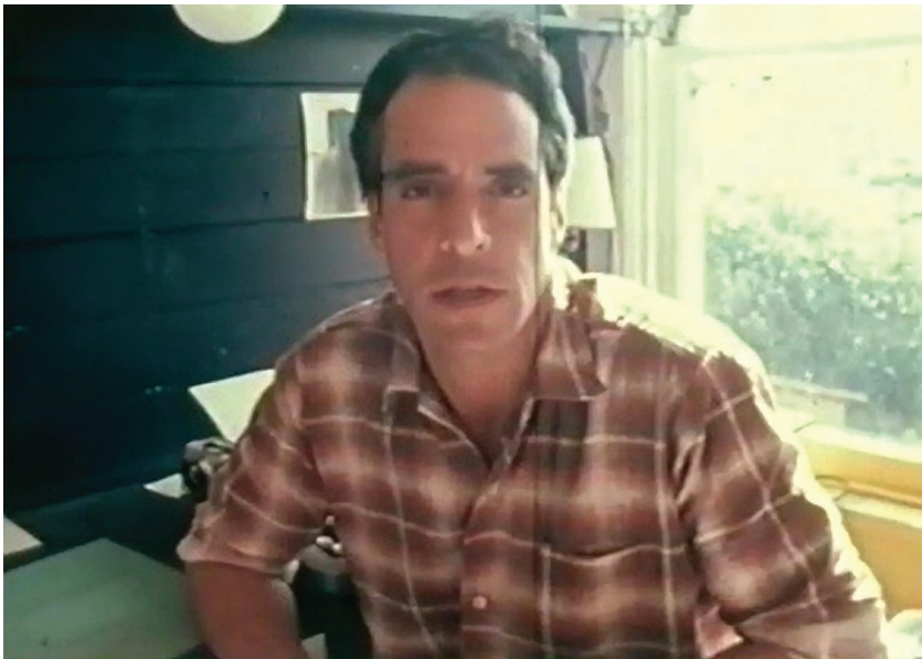
Figures 5 et 6. Scènes de lutte de classe au Portugal (Robert Kramer et Philip J. Spinelli, 1977).