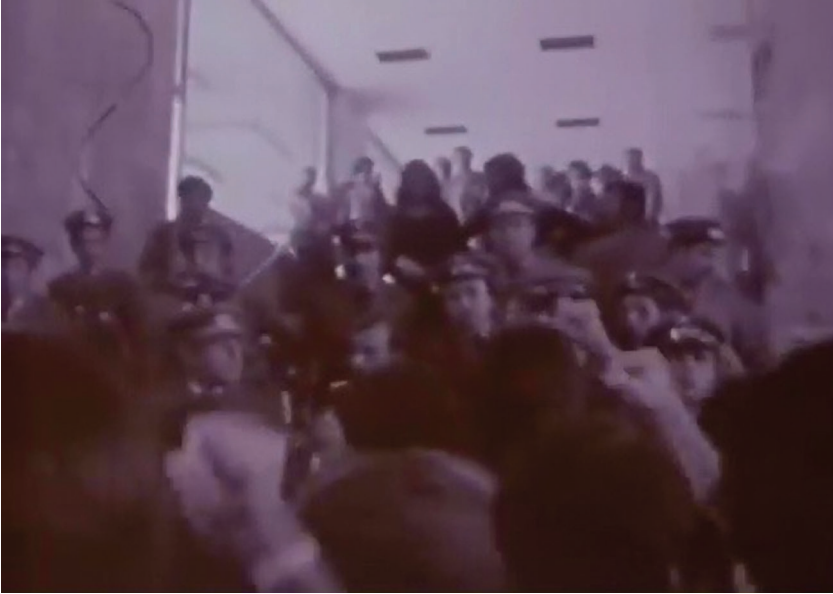
Figure 4. Scènes de lutte de classe au Portugal (Robert Kramer et Philip J. Spinelli, 1977).

montage se fait plus tranchant, résultat d'une incapacité, pour les réalisateurs, à filmer l'événement dans une continuité pleine et entière.