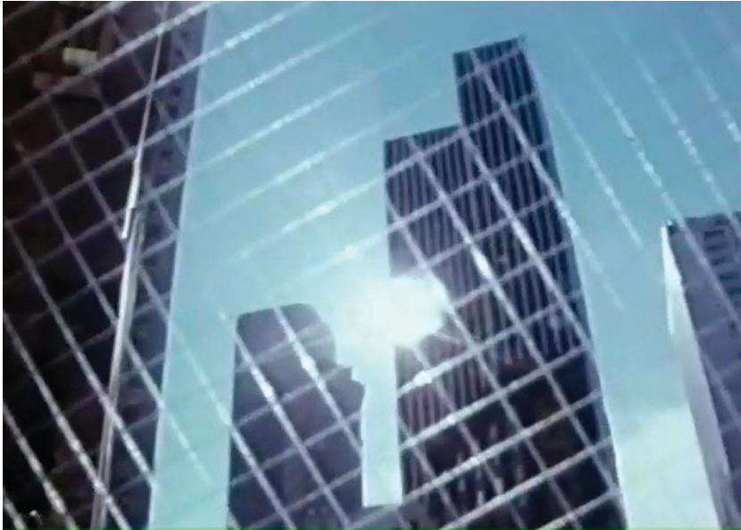
Figure 2. Scènes de lutte de classe au Portugal (Robert Kramer et Philip J. Spinelli, 1977).

total, un monde entier qui introduit une nouvelle forme de comportement collectif. Jameson voit l'espace total de cet hôtel comme une allégorie de l'hyperespace du marché mondial dominé par les corporations du capitalisme tardif. Si le postmodernisme selon Jameson nous demande d'appréhender les choses comme totalité tout à la fois négative et positive, d'accepter les choses non sans renoncer au jugement critique, il n'en va pas de même chez Kramer. En toute logique morale, le pouvoir financier renforce la posture du cinéaste résistant devant l'ordre établi.