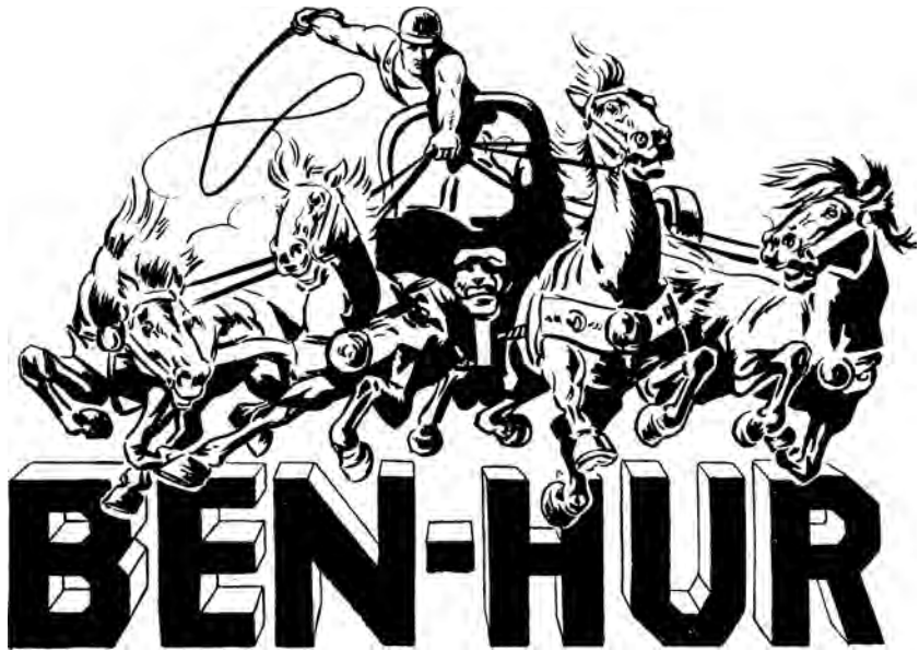
Figure 10. «Ben-Hur», dessin promotionnel. Source: La vérité sur Ben-Hur , Paris, Cinémagazine Éditions, 1929.