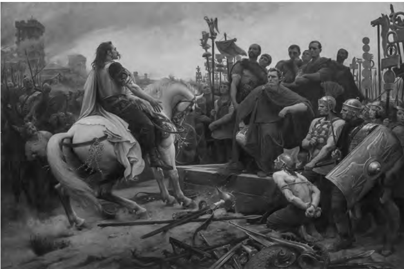
Figure 8. Lionel Royer, Vercingétorix devant César , 1899. Huile sur toile, 321 cm × 482 cm. Musée Crozatier, 1903.59.

C'est que cette imagerie du XIX e siècle avait été largement diffusée. La célèbre peinture de Lionel Royer qui se trouve aujourd'hui au musée Crozatier du Puy-en-Velay, Vercingétorix jette ses armes au pied de César (Fig. 8), fut reproduite dans Le Monde illustré l'année même de sa création et se retrouva rapidement dans les livres d'histoire et les manuels scolaires (Hallopeau 1980, 33), aussi n'est-il pas surprenant d'en retrouver la trace dans l'affiche du film Vercingétorix produit par Pathé en 1909 (Fig. 9). Le tableau acquit aussi une grande réputation aux États-Unis par l'intermédiaire des ouvrages