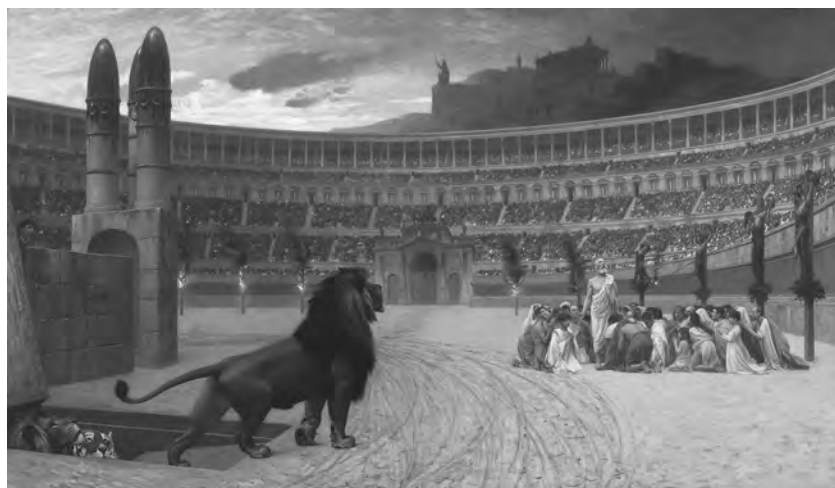
Figure 3. Jean-Léon Gérôme, Dernières prières des martyrs chrétiens, 1863-1883. Huile sur toile, 87,9 cm × 150,1 cm. Collection du Walters Art Museum, 37.113.