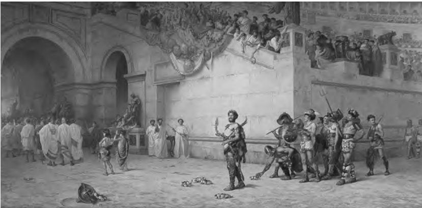
Figure 5. Edwin Blashfield, Commodus Leaving the Coliseum, 1878. Huile sur toile, 123,2 cm × 231,1 cm. Sloane Collection, Hermitage Museum & Gardens, 1941.0022.01.