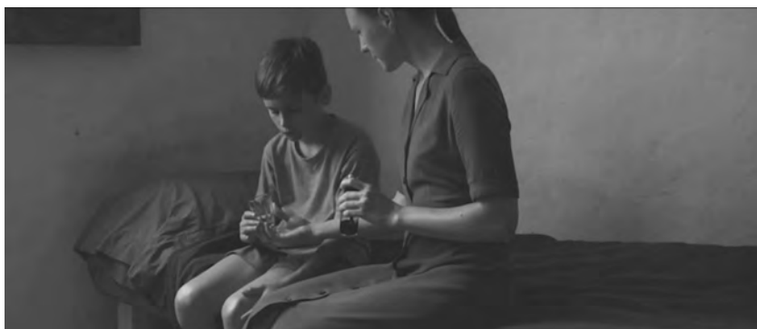
Figure 2. Évolution (Lucile Hadžihalilović, 2015).