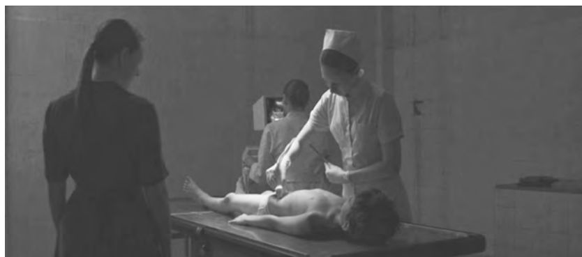
Figure 1. Évolution (Lucile Hadžihalilović, 2015).

Franklin, pour penser les capacités transformatives de la reproduction d'imagerie. Le transbiologique traite des frontières de plus en plus ambiguës entre l'humain, l'animal et la machine, où une biologie non binaire est à la fois construite et innée: