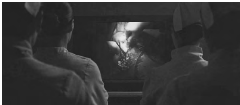
Figure 6. Évolution (Lucile Hadžihalilović, 2015).

l'écran avec des sons de corde, échantillonnés et ralentis, provenant d'un slasher ; la mauvaise mère de Psycho , corporellement contagieuse, n'est jamais loin. Le but de ces visionnements n'est pas clair: s'agit-il de vidéos d'entraînement pour les femmes en matière de techniques médicales «DIY» qu'elles essayent d'adapter à de nouveaux corps? S'agit-il de rappels idéologiques de l'un des mécanismes les plus disciplinaires de la reproduction normative, soit le contrôle chirurgical qui place le corps en gestation à la merci de l'emploi du temps d'un médecin 4 ? Dans un cas comme dans l'autre, la scène nous rappelle que la «transbiologie consiste en grande partie à de la rétro-ingénierie ou de l'ingénierie transversale» (Franklin 2006, 179, notre traduction). Pendant que les femmes retournent cette violence sur des corps marqués comme masculins, guidant des créatures humanoïdes dans et en dehors des corps des garçons à travers des césariennes, la séquence cinématographique qui nous permet d'en être témoins nous sensibilise au travail du regard. En effet, au-delà du récit, la scène oblige de façon extensive à nous demander comment nous pouvons rester «avec la violence de la gestation, plutôt que la priver de notre affection [...] non pas parce que la violence est d'une certaine manière naturelle, mais précisément parce qu'elle n'a pas de raison d'être» (Lewis 2019, 139, notre traduction).