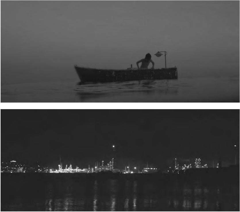
Figure 4. Évolution (Lucile Hadžihalilović, 2015).

sexuellement pervers et érotique: l'évasion, le futur et l'intégrité corporelle ressemblent beaucoup à du rejet envers le garçon blanc, et les rivages pollués et dépeuplés de l'anthropocène sont l'alternative de l'île-prison.