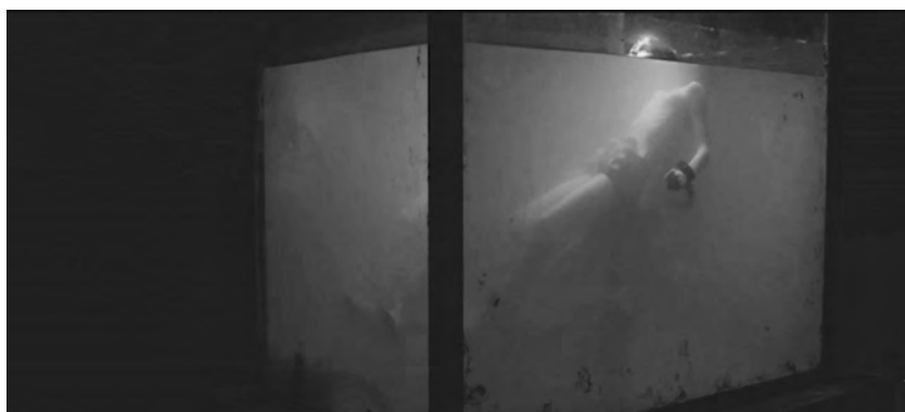
Figure 3. Évolution (Lucile Hadžihalilović, 2015).