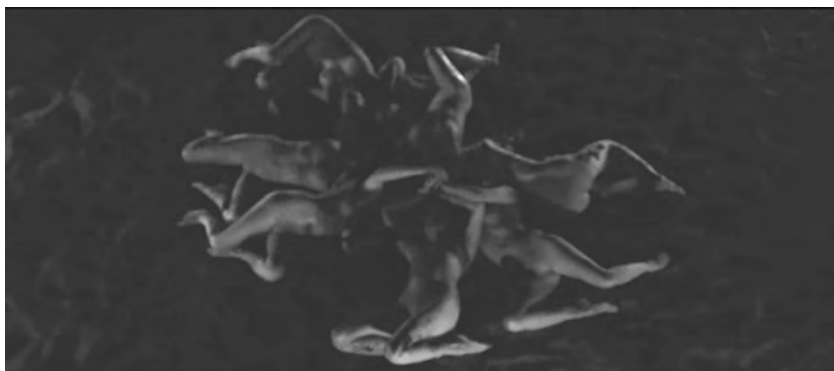
Figure 8. Évolution (Lucile Hadžihalilović, 2015).