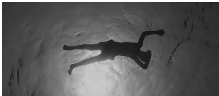
Figure 5. Évolution (Lucile Hadžihalilović, 2015).

cloisonnement de la particularité et par le dénigrement de toute idée exhaustive du commun et de la mise en commun. À l'intérieur de la catégorie de la connectivité intraspécifique humaine, nous sentons la force qui formate des stratifications asymétriques tant au sein de l'humanité qu'en dehors. Le projet de pensée incommensurable de l'inhumanité est l'active autoharmonisation de la vie comme correspondance mélangée, collision, entrelacement et accord entre personnes et objets, choses, formations et regroupements non humains. (Muñoz 2015, 210, notre traduction)