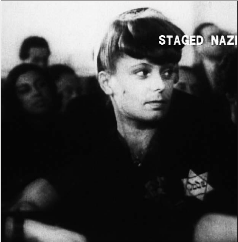
Figure 5 : Theresienstadt (Kurt Geron, 1945).

Par excès de zèle, le totalitarisme de la joie se trouve poussé jusqu'à l'absurde dans les scènes d'hôpital qui montrent des malades étonnamment souriantes, exprimant leur bien-être devant la caméra 13 . La dissimulation passe encore par la fuite des regards qui signale les artifices de la mise en scène et les consignes données aux sujets filmés. Dans l'ensemble des plans conservés, les regards caméra sont rares : même les figurants filmés de face, en plan serré, s'appliquent à ignorer l'appareil.