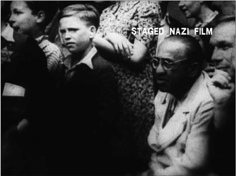
Figure 7 : Theresienstadt (Kurt Geron, 1945).