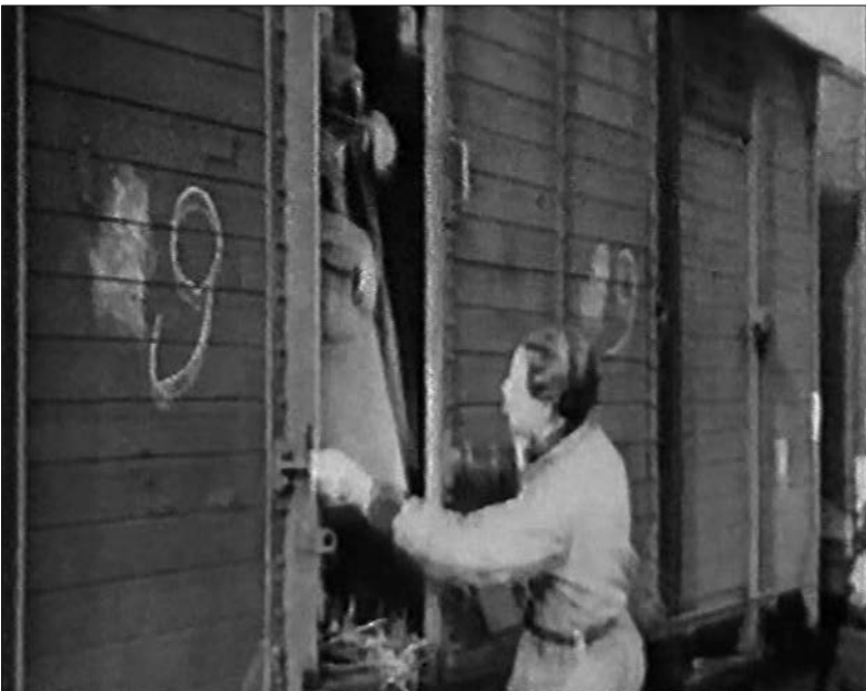
Figure 11 : Lager Westerbork (Rudolf Breslauer, 1944).

On trouve dans les rushes de Westerbork les images d'un autre convoi, nettement plus bucolique. Plusieurs scènes consacrées