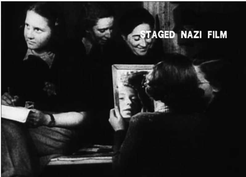
Figure 6 : Theresienstadt (Kurt Gerron, 1945).

Pourtant, quelques signes viennent soudain rappeler, depuis le cœur de l'image, les conditions de sa production. Certains figurants ne respectent pas les consignes et lancent des regards furtifs vers la caméra. Dans le dortoir des femmes, une jeune fille filmée de dos observe l'équipe de tournage dans le reflet d'un miroir. Au milieu de la foule des figurants, un garçonnet se détourne du match de football pour darder son regard sur l'opérateur. Par ces imperceptibles déplacements où une curiosité subreptice l'emporte sur l'obéissance, des regards intenses viennent soudain rencontrer le nôtre.