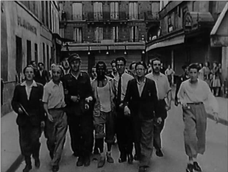
Figure 2 : La libération de Paris (Comité de libération du cinéma français, 1944).

La mise en regard des images de La libération de Paris avec les plans non utilisés permet ainsi de multiplier les points de vue sur l'événement et d'élargir le cadre de prise de vue du film officiel. Ces images oubliées révèlent encore la présence de personnages secondaires et de microévénements négligés par les monteurs du CLCF. Dans les rushes du film, un plan tourné sur la place de l'Étoile permet d'entrevoir un combattant noir, le bras en écharpe, qui suit de près le héros du jour. Ce personnage fait trois apparitions dans La libération de Paris , où il demeure sans nom et sans destin : on le voit escorter un soldat allemand ; juché sur un char conquis ; soutenu par deux camarades, le bras en sang, après une fusillade.