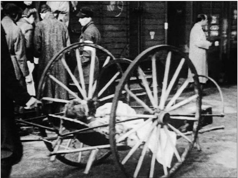
Figure 13 : Lager Westerbork (Rudolf Breslauer, 1944).