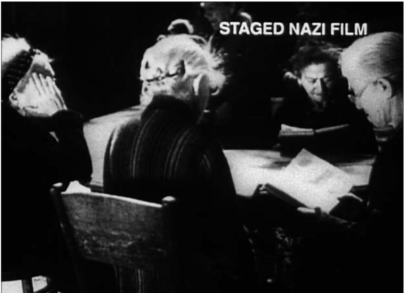
Figure 8 : Theresienstadt (Kurt Geron, 1945).