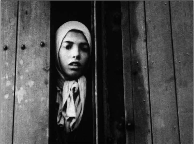
Figure 12 : Lager Westerbork (Rudolf Breslauer, 1944).