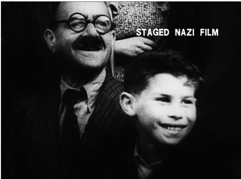
Figure 4 : Theresienstadt (Kurt Gerron, 1945).

Dans Theresienstadt , le camouflage passe également par la mise en scène d’une comédie du bonheur qu’exprime le jeu forcé des rires et des sourires.