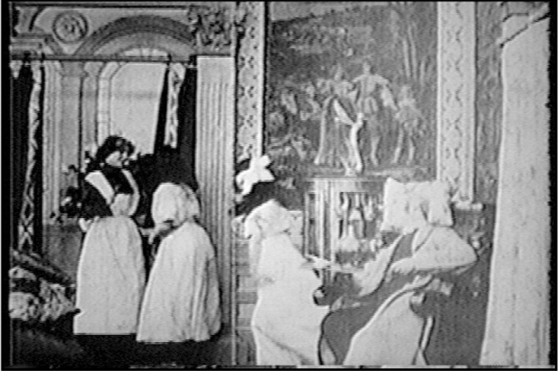
Figure 5. Photogramme tiré de His Last Burglary (Biograph, 1910).