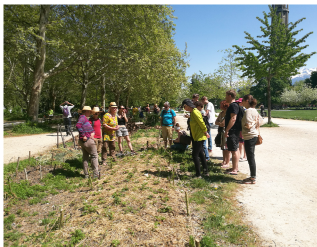
FIGURE 4 Visite d'un jardin dans le cadre des «48 heures de l'Agriculture Urbaine», Grenoble, mai 2018

Le jardinier présent au jardin s'est isolé à plusieurs reprises et a occasionnellement jardiné avec les jardinières. Les femmes ont jardiné ensemble et se déplacent ensemble dans le jardin.