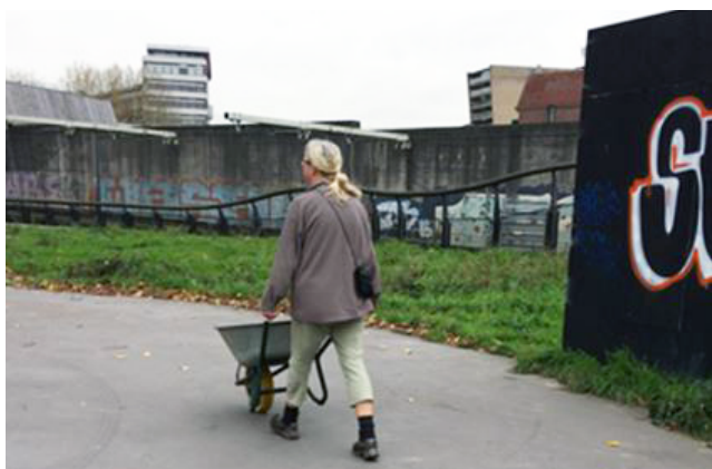
FIGURE 6 Activités de collecte, Tuin op Hofbogen, Rotterdam, octobre 2017

Le fait d'abriter ruches, plantes médicinales et compost conduit à la discussion et à l'apprentissage. L'apprenante en plantes médicinales peut devenir l'enseignante sur le compost, la minute suivante. Les rôles sont mouvants, même si un leadership peut s'exercer, ce rôle peut être variable selon les tâches et les saisons. La transmission des savoirs se fait à différentes échelles et auprès de différents