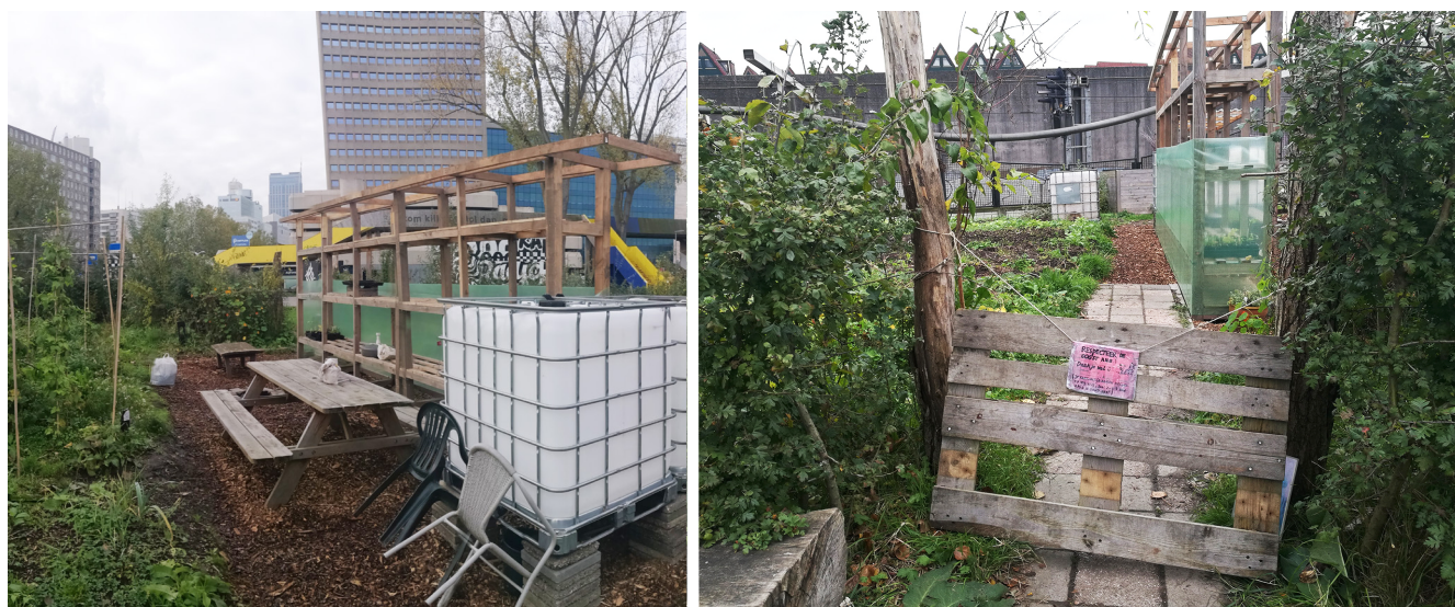
FIGURE 5 Installation dans un jardin rotterdamois, automne 2018

tiens regarde, j'ai ramassé ça, j'ai ramassé trois courges, prends-en une» (Kenza, Grenoble).