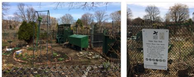
FIGURE 1 M&S Garden, un jardin communautaire situé à Boston

Les métropoles sont actuellement confrontées à des tensions entre la mise en place d'une gestion de la densification urbaine, l'organisation des fluidités, l'intégration de l'écologie urbaine et les demandes sociales, dont le bien-être en ville (Lefeuvre, 2015). Loin d'être un fait nouveau dans la conception des modèles urbains de l'habiter, les relations à la nature font partie des besoins exprimés aujourd'hui (Wright, 1970). À cet égard, les acteurs municipaux et urbains ainsi que les personnes qui vivent en ville redécouvrent la fonction nourricière des villes et, plus largement, des métropoles (Brand, 2017). Les jardins partagés peuvent ainsi devenir des composants de l'agriculture urbaine et être pensés comme éléments nourriciers (Pourrias et al. , 2012; Chalmandrier et al. , 2017; Scheromm, 2015; Brand et al. , 2017), à l'heure où les métropoles sont soumises à un mode de pensée aménagiste standardisé fondé sur les franchises et les labels. En conséquence, les acteurs municipaux et urbains s'efforcent de trouver des modalités de reconnaissance des aménités de leurs territoires. Dans ce contexte, les jardins partagés deviennent un objet de convoitise en vue de la mise en place d'une transition écologique. Ils sont animés par des personnes regroupées en collectifs (Simon-Rojo et al. , 2016) qui ont développé un modèle d'organisation sociale et écologique hérité des community gardens new yorkais, comme dans l'exemple de Boston (figure 1).