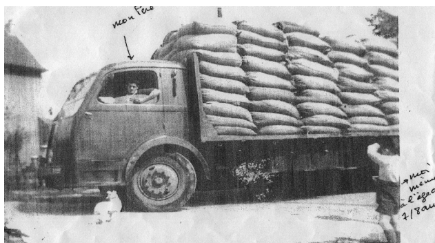
FIGURE 5 Photographie d'un employé de l'usine du CMMP au volant d'un camion transportant les sacs d'amiante (années 1950)

Ainsi, si les souvenirs de chacun, voire dans notre cas leurs collectes et leurs retranscriptions, participent à la construction d'une mémoire collective, on observe parfois un décalage entre les deux: entre ce qu'un individu retient d'un événement et ce que la mémoire collective de ce même événement retiendra. Le témoignage d'un ancien riverain sur le transport des minerais de l'usine, recueilli par le Collectif des riverains, l'illustre: «Alors, c'était très joli ce camion qui partait avec le mica, parce que le mica, comme ça volait, ça faisait de belles petites couleurs». Le souvenir individuel ne retient que la beauté de la dispersion des paillettes de mica dans l'air, tandis que la mémoire collective est focalisée sur l'absence de mesures permettant d'empêcher la dispersion de substances cancérigènes lors de leur transport. Il convient de préciser ici que l'amiante était transporté dans les mêmes conditions que le mica (figure 5).