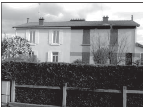
Figure 2 L'habitat Michelin et ses transformations

L'habitat Michelin proche de sa conception originelle. Quatre maisons (RDC +1 niveau) mitoyennes. Façades de deux d'entre-elles.