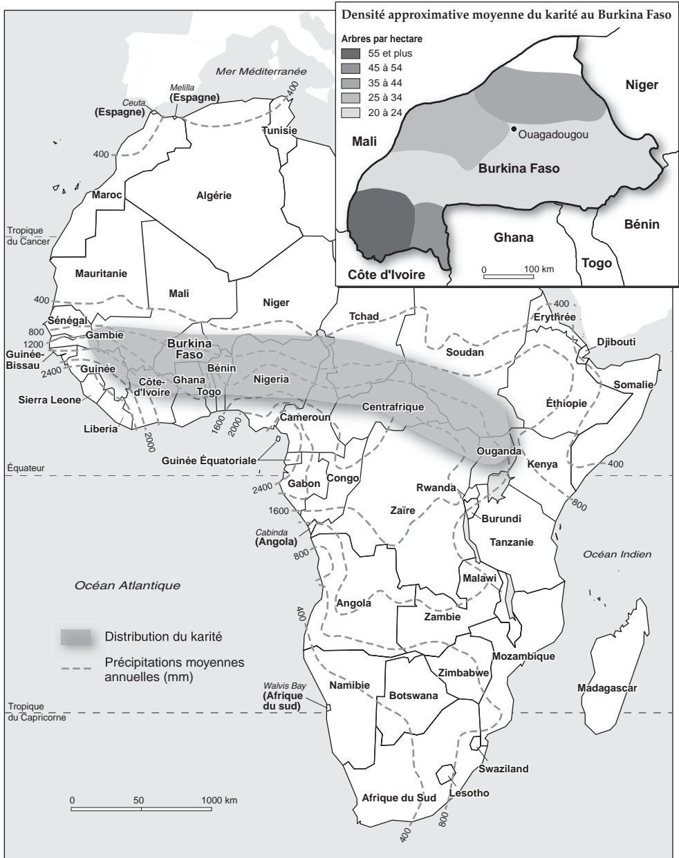
Figure 3 Distribution du karité en Afrique subsaharienne

Sources : Terpend (1982) pour la distribution du karité en Afrique subsaharienne Terpend (1982), d'après IRHO (1954) pour la densité moyenne du karité au Burkina Faso