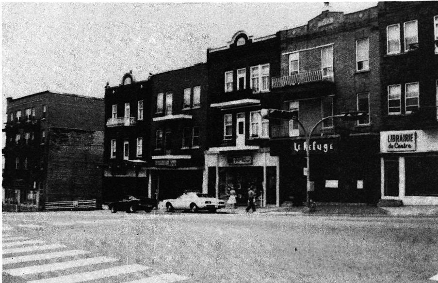
Photo 1. Antenne de quartier, rue de la Station, Shawinigan (commerces, services, professionnels et habitat).

L'absence de maisons artisanales regroupées en faubourg-village (ou noyau de faubourg) conduit à nous pencher immédiatement sur le premier ensemble d'habitations de la phase manufacturière identifié au premier degré d'association. Même s'il se différencie des autres aires d'habitations, ce regroupement morphologique est aujourd'hui difficilement repérable. Il faut puiser dans les données historiques si on veut parvenir à le situer dans le scénario théorique de la forme urbaine. On apprend ainsi que dès le départ de la construction, ces unités ont privilégié la fonction commerciale le long de certains axes. Le zonage fonctionnel n'existe à peu près pas. Les groupes sociaux se retrouvent partout dans cet espace. Les professionnels ou les commerçants occupent le rez-de-chaussée et les ouvriers logent aux étages supérieurs. Cette situation n'a donc guère changé sauf qu'aujourd'hui l'habitat aux étages supérieurs est plus rare et les professionnels occupent le rez-de-chaussée sans l'habiter (photo 1).