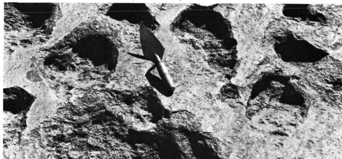
Photo 3 Vue détaillée de quelques alvéoles de corrosion dans anorthosite, rivage sud-est du lac Saint-Jean ; l'évidement des cavités est lié à l'action des vagues.