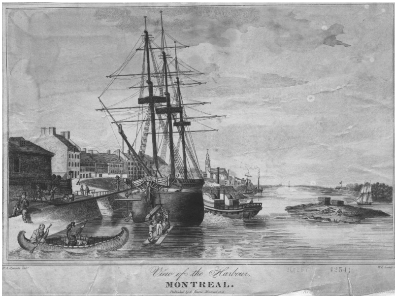
Le port de Montréal vers 1830. Gravure de R. A. Sproule et W. L. Leney.

riche pour défrayer ses dépenses domestiques sans dépendre pour tous les objets locaux de taxes sur le commerce britannique». Quant aux Bas-Canadiens habitant le territoire en question, Merritt ne voyait aucun inconvénient à la préservation des titres français pour les quelques années nécessaires à l'assimilation de la population, un processus qu'il considérait comme inévitable, citant l'exemple de la Louisiane 15 . Quelques jours plus tard, la proposition d'annexer Montréal au Haut-Canada reçoit un appui de taille lors du témoignage de R. J. Wilmot Horton, sous-secrétaire d'État aux colonies, qui croit qu'elle constitue la seule voie de solution des conflits entre les colonies compte tenu de l'opposition à une union législative qui existe dans les deux provinces. Seul le transfert de Montréal à la province du Haut-Canada afin de lui donner un port de mer pourrait aplanir les difficultés. Quant à l'opposition des Canadiens, Horton se dit sensible à la question, mais il conclut «que vu les circonstances relatives des deux provinces, et le devoir rigoureux de la mère patrie d'agir avec justice envers l'une et l'autre, je ne vois moi-même d'autre alternative que celle-là 16 ».