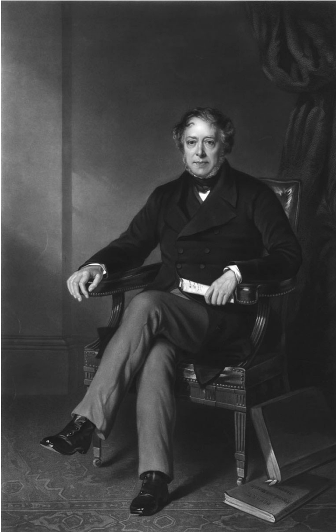
Edward Ellice, marchand et homme politique britannique.

La formulation définitive de la loi établissant l'union législative du Haut et du Bas-Canada afin de créer la province du Canada semble clore le débat sur sort de Montréal. L'union, en effet, répondait dans un certain sens aux griefs des Haut-Canadiens et il exauçait les vœux des Constitutionnels qui réclamaient d'être libérés de la « tyrannie » d'une majorité française. Cependant, plusieurs torys haut-canadiens continuent de protester contre cette union forcée avec