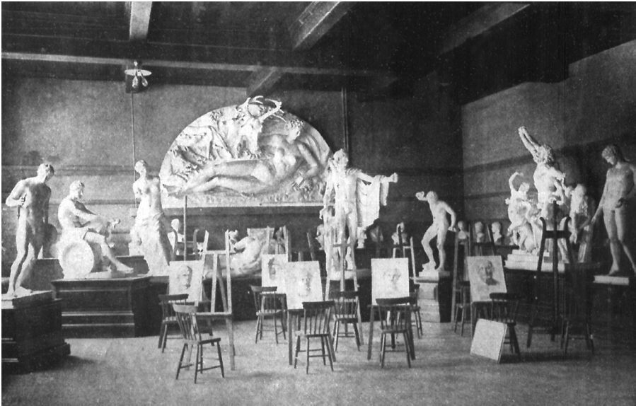
Fig. 10 Salle de cours de l'Art Association of Montreal, aile Taylor, photographie parue dans The Standard , 18 novembre 1905, p. 4. On reconnaît au fond la Nymphe de Fontainebleau , flanquée de la Vénus de Milo et de l' Apollon du Belvédère , le Laocoon est sur le mur de droite.