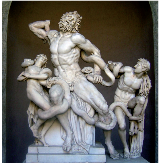
Fig. 4 Laocoon , marbre, Musée Pio-Clementino, Vatican.