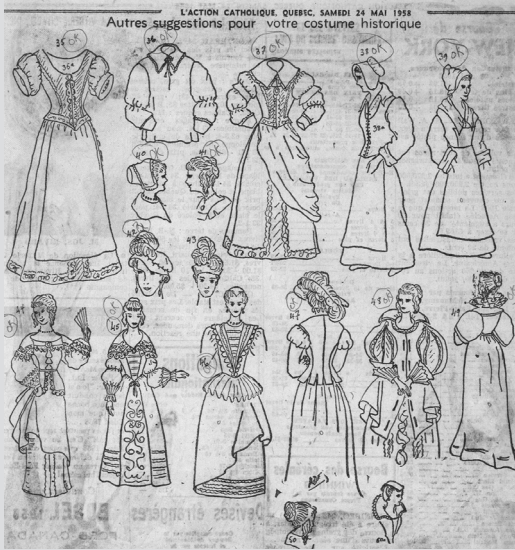
Concours de costumes lors des fêtes du 350 e anniversaire de la fondation de Québec. Ces croquis ont paru dans L'Action catholique en mai 1958.