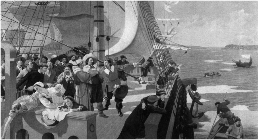
L'arrivée de Champlain à Québec d'après le tableau de Henri Beau (1904), réalisé pour la salle du Conseil législatif du parlement de Québec. Coll. MNBAQ.

Aspirante à la vérité historique et reconnaissant la valeur inégale ou la rareté de certains documents, Madeleine Doyon note des commentaires critiques de l'une ou l'autre source consultée. Dans son manuscrit sur le costume canadien, elle écrit qu'entre autres :