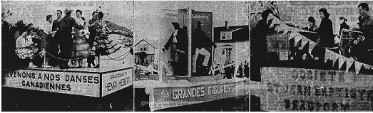
Chars allégoriques parus dans L'Action catholique , 30 juin 1958, p. 7.

Le costume entretient aussi un lien privilégié avec la danse, les programmations comptant toujours plusieurs activités où la danse, dont les protagonistes sont costumés, est à l'honneur ; il peut s'agir de bals ou de spectacles, de danses anciennes, folkloriques ou modernes 35 .