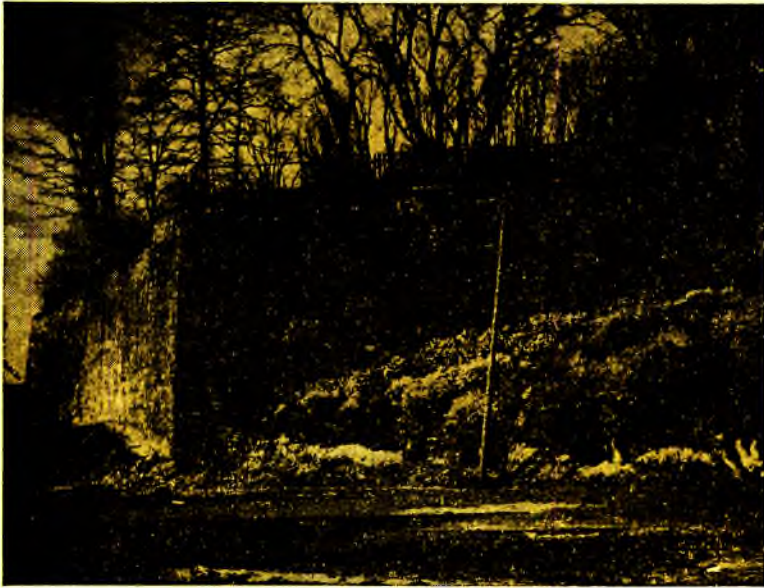
Cavalier du Moulin construit en 1693 par Jean Lerouge et Pierre Janson, d'après les plans du chevalier de Beaucourt.