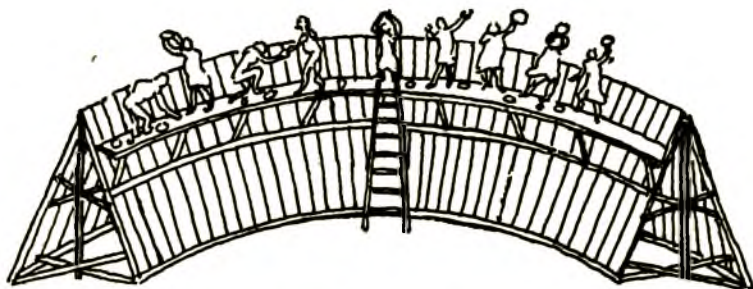
La palissade iroquoise selon Jacques Cartier