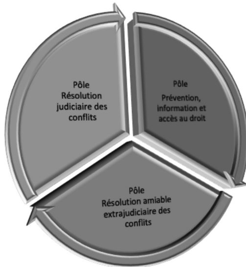
Figure 2 Représentation schématique du paradigme de la multipolarité

nationales 78 nous semble éclairante pour illustrer le sens du paradigme de la multipolarité, tel qu'il apparaît dans les réflexions de ces travaux, tout en n'étant pas pleinement satisfaisante. En effet, en matière de relations internationales, la multipolarité figure comme une solution de rechange à l'approche unipolaire qui est, comme nous l'avons exposé précédemment, la domination d'une seule puissance sur toutes les autres ; la multipolarité mise alors sur l'équilibre et le concert, tout en admettant la compétition entre les acteurs 79 . Ce dernier point l'éloigne considérablement du paradigme de la multipolarité dans l'acception soutenue par notre texte. Le choix ne se porte pas dans l'approche privilégiée dans notre étude, comme c'est le cas en relations internationales, sur le concept de multipolarité à défaut de pouvoir ériger un système unipolaire : le paradigme de la multipolarité est plutôt retenu en tant que paradigme d'organisation et de spécialisation fonctionnelles du système de justice civile non seulement pour son efficacité et son efficience, mais encore parce qu'il paraît plus en adéquation avec les attentes et les besoins des citoyens en matière d'accès à la justice. C'est notamment lui qui structurera une différenciation fonctionnelle entre la diversité des procédés de justice dans une société en un regroupement en pôles spécialisés (figure 2).