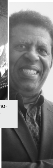
Dany Laferrière. (Photo : Serge Pallascio).