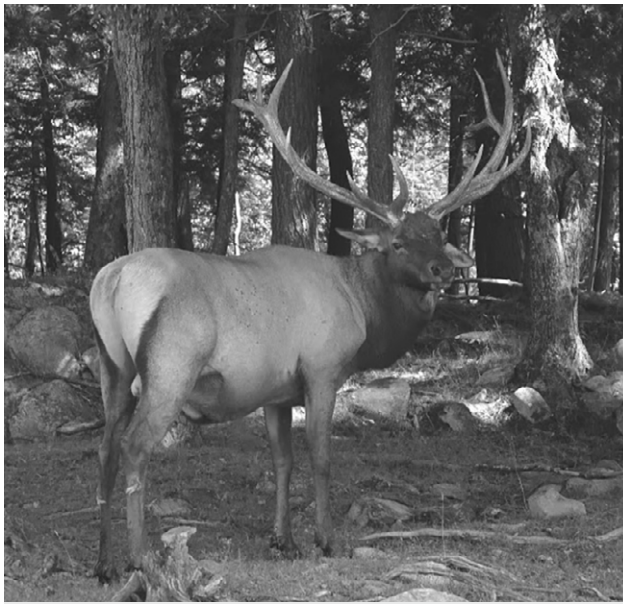
Le wapiti ou cerf américain L'aire de répartition du wapiti englobait la vallée du Saint-Laurent au début de la Nouvelle-France. Mais son abondance demeure une question à l'étude. (Daniel Fortin).

de son manuscrit, le jésuite discourt sur les preuves de cette propriété qu'il aurait lui-même observées :