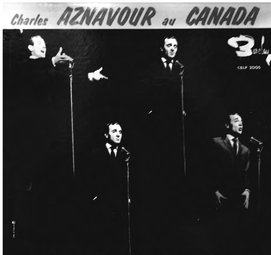
Aznavour au Canada.

Charles Aznavour, Bravos du music-hall à Charles Aznavour (1957). 10 titres, 33 tours, 25 cm. (Ducretet Thomson, 260 V 090).