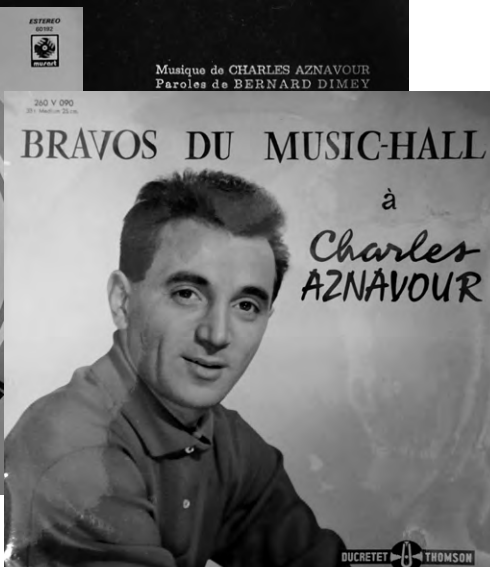
Différentes pochettes de disques au fil de la longue carrière de Charles Aznavour. (Au Canada, en diverses langues et même licenciées).