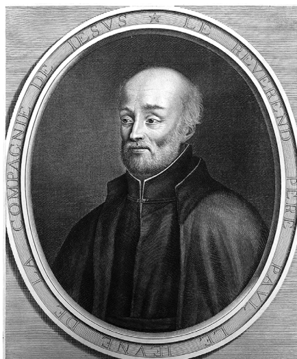
Paul Le Jeune. ( https://commons.wikimedia.org/wiki/Category:Paul_Le_Jeune#/media/File:Paul_Le_Jeune_-_Rene_Lochon.jpg ).

Cette introduction montre, en elle-même, la portée de l'utopie jésuite en Nouvelle-France qui s'exprime à la fois dans une volonté de refondation du christianisme loin des vices européens et dans une épreuve spirituelle des individus confrontés aux rigueurs de l'éloignement et à un environnement hostile. Plus loin dans la même relation, Le Jeune écrit d'ailleurs : « Les hôtelleries qu'on trouve en chemin sont les bois mêmes : à l'entrée de la nuit on s'arrête pour cabaner; chacun défait ses raquettes, desquelles on se sert comme de pelles pour vider la neige de la place où on veut coucher. La place nette, et faite en rond ordinairement, on fait du feu tout au beau milieu, et tous les hôtes s'assistent à l'entour, étant abrités par le dos d'une muraille de neige, ayant le Ciel pour couverture de la maison. Le vin de cette hôtellerie c'est