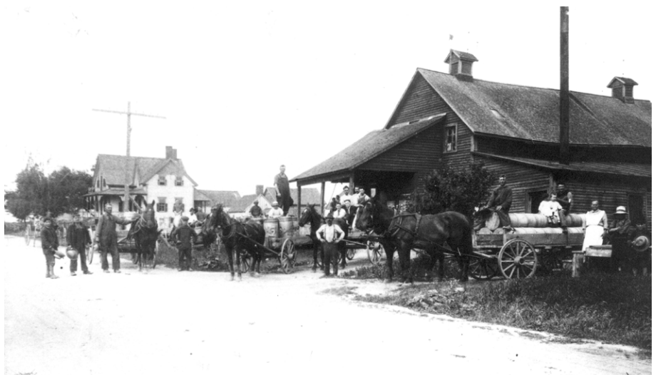
La fromagerie Chapdelaine à Saint-Guilhem, en 1921.

Le mouvement coopératif agricole québécois a connu une forte expansion