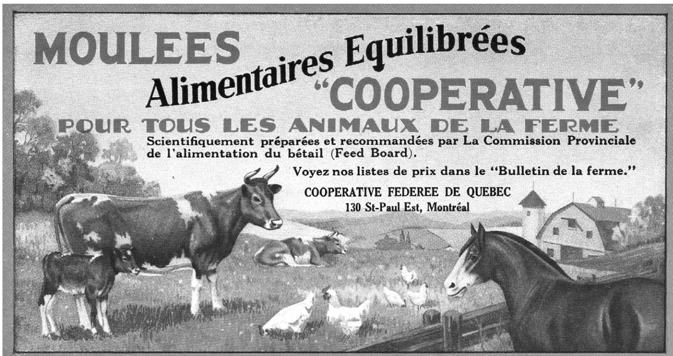
Buvard publicitaire, vers 1930. (Coll. de l'auteur).