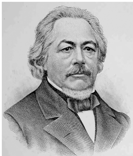
ÉTIENNE PARENT, Journaliste.

C'est à Étienne Parent que l'on doit les premières réflexions sur l'économie sociale. Homme politique, journaliste et fonctionnaire, Parent a été proche des patriotes avant que ceux-ci ne se radicalisent au milieu des années 1830. Acceptant pragmatiquement l'Acte d'Union de 1840, Parent se fait ensuite l'un des principaux théoriciens du nouveau nationalisme canadien-français de la survivance. Au milieu des