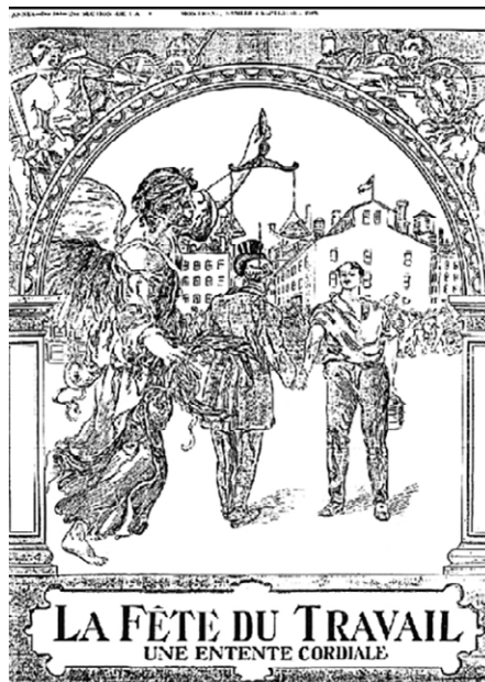
À l'occasion de la fête du Travail, La Patrie illustre la rencontre « cordiale », protégée par la justice, entre un travailleur fier et un capitaliste respectueux. « Fête du Travail », La Patrie , 4 septembre 1909. ( http://collections.banq.qc.ca/ark:/52327/766978 ).

C'est cette conception libérale des vertus de l'entraide qui structure le processus d'institutionnalisation de l'économie