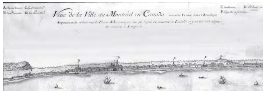
Vue de la ville du Montréal en Canada.

Louis Tronson a été fort surpris d'apprendre l'étendue de l'affaire. Il réagit rapidement pour étouffer la cabale mystique avant qu'elle ne devienne incontrôlable, qu'elle ne nuise à la réputation des communautés, voire qu'elle ne fasse scandale jusqu'à la cour du roi.