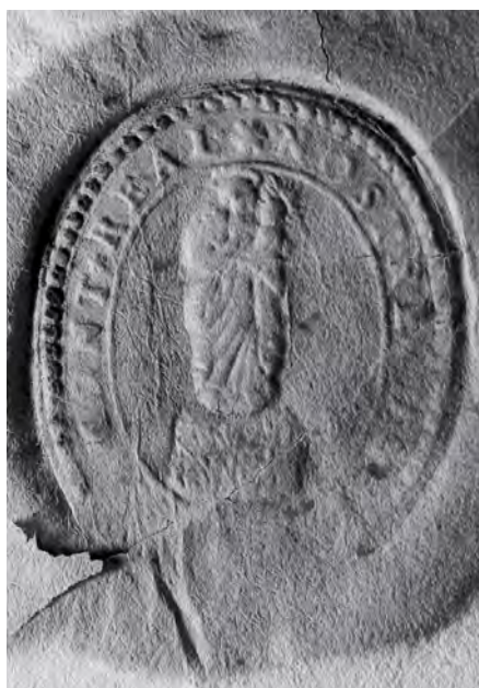
Sceau de la société de Notre-Dame. Photo Pascale Bergeron. (Coll. Prêtres de Saint-Sulpice).

En 1689, Ville-Marie était une petite bourgade d'au plus 1 400 habitants en passe de devenir non seulement un centre névralgique du commerce des fourrures, mais aussi un siège administratif, judiciaire et militaire hautement stratégique. La ville ne comptait encore que trois communautés religieuses. Les Sulpiciens, arrivés à Ville-Marie en 1657 en remplacement des Jésuites, formaient une compagnie de prêtres séculiers fondée en France en 1641 par Jean-Jacques Olier. Ils desservaient la paroisse Notre-Dame et les petits hameaux situés ici et là sur l'île. Ils étaient également missionnaires auprès des Amérindiens et, depuis 1663, les seigneurs de Montréal. La Congrégation de Notre-Dame était pour sa part une communauté de femmes non cloîtrées vouée à l'instruction de la jeunesse. Elle avait été fondée en 1659 par Marguerite Bourgeoys, première institutrice de Montréal. Enfin, les services hospita-