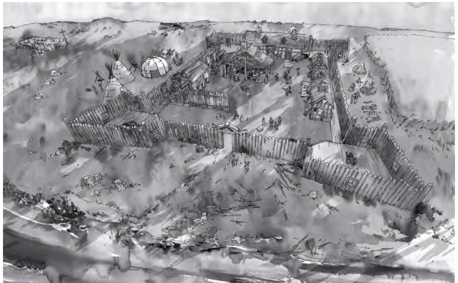
À quoi pouvait ressembler le fort de Ville-Marie? Cette représentation s'appuie sur plusieurs observations faites sur le terrain : mis au jour entre fleuve et petite rivière Saint-Pierre, un bastion confirme l'emplacement du fort et permet d'en proposer la volumétrie. Un puits, un bâtiment, des enclos et ce qui s'avérerait être une base de forge sont aussi identifiés. Le cimetière se trouve à l'extrémité de la pointe. Illustration : Marc Holmes, Pointe-à-Callière. (E52C1078AlainVandal-PAC.tif).

Le musée s'est attelé à la tâche, pas à pas et avec l'aide de chercheurs d'horizons divers, afin de « tisser » cette complexe courtepoinette que l'on devine encore chargée d'énigmes et de questions non résolues... Mais que de nouvelles données ont surgi récemment! Nous proposons ici quelques pistes de découvertes relatives aux relations entre Autochtones