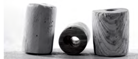
Perles de wampum. Tant les Européens que les Amérindiens fabriquent ces perles de coquillages provenant de la côte est de l'Atlantique, à l'aide d'outils en fer. Les colliers de wampum sont des objets diplomatiques de première importance.

Grâce aux négociations menées à la fin du XVII e siècle par Callière, par le chef huron Kondiaronk et par le chef iro-