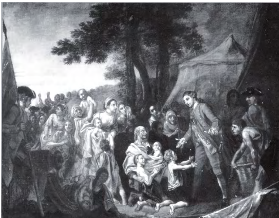
Ce tableau représente le général Amherst nourrissant la population affamée de Montréal après la reddition de la ville en 1760. Une image d'Épinal qui n'a rien à voir avec les faits. Cette toile du peintre Francis Hayman, qui faisait partie d'une suite commémorant les victoires anglaises pendant la guerre de Sept Ans, ornait les murs de Vauxhall Gardens, près de Londres.

Cette stratégie implique une grande préparation et le début de la campagne est tardif. Ainsi, Murray se met en mouvement à partir de Québec le 14 juillet avec 4 navires de guerre, 9 galères, 40 bâtiments de transport et 26 bateaux. Il évite de perdre son temps sur des objectifs secondaires. Ainsi, il ne s'arrête pas à Deschambault, ni au fort de la rivière Jacques-Cartier ou encore à Trois-Rivières. Montréal est l'objectif. En remontant le Saint-Laurent, il en profite pour désarmer la population et leur faire prêter serment.