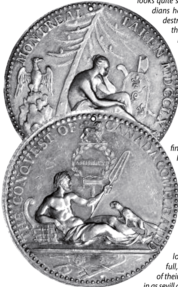
Avers et revers de la médaille « Montreal Taken » Angleterre, argent, 1760. (Coll. privée).

de l'île aux Noix trois jours plus tard. L'étau se resserre sur Montréal.