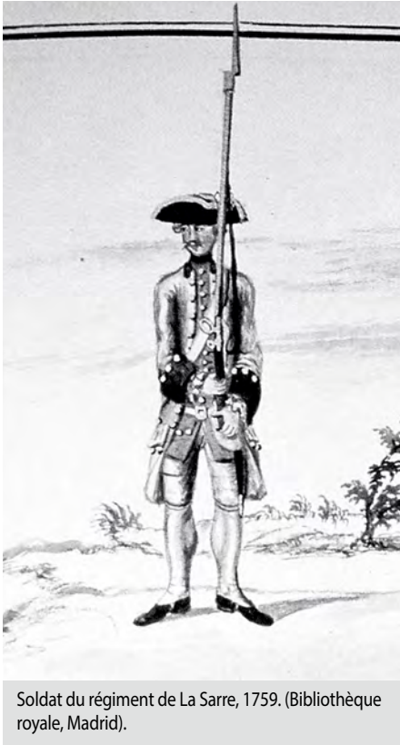
Soldat du régiment de La Sarre, 1759. (Bibliothèque royale, Madrid).

d'écrire dans son journal personnel : « I believe never three Armys, setting out from different & very distant Parts from each other joynd in the Center, as was intended, better than we did, and it could not fail of having the effect of which I have just now seen the consequence. » Amherst est en effet satisfait de sa réussite sans effusion de sang, sans pillage et sans destruction inutile. Un point de discordance éclate bientôt à propos des drapeaux des bataillons français. Amherst exige qu'on les lui remette. Or, Lévis prétendra qu'ils étaient en mauvais état et ont été détruits durant la guerre. Le 10 septembre, Vaudreuil et Lévis donneront leur parole d'officier que cela est vrai. Amherst accepte. Toutefois, le 11 septembre, Amherst demande au colonel Haldimand de s'assurer que les drapeaux français vus récemment seront livrés et que M. de Vaudreuil sera averti qu'il faut les trouver, sinon, tous les bagages seront visités. Il ne semble pas avoir de suite à cette lettre. Est-ce que Lévis qui voulait continuer le combat